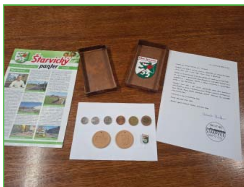
Do schránky v soše byly uloženy informace pro další generace