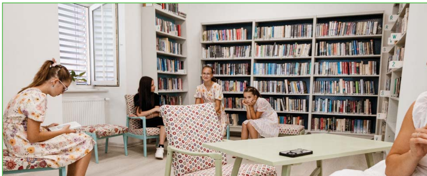
Knihovna po rekonstrukci