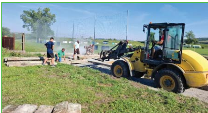
Úprava plochy na kontejnery