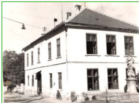
Archivní foto školy z roku 1955

V první polovině letošního roku proběhla větší rekonstrukce části obecního úřadu. Možná by někdo mohl namítnout, že jsou důležitější projekty, ale budova obecního úřadu už si modernizaci bezesporu zasloužila.