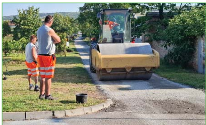
Oprava komunikace za 3. řádkem