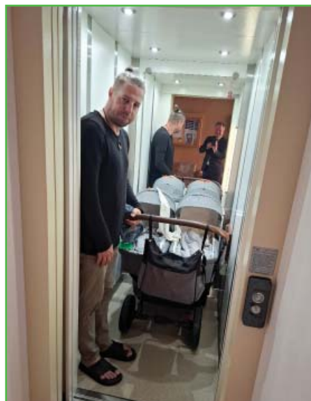
Díky výtahu je o 2. patro bezbariérové