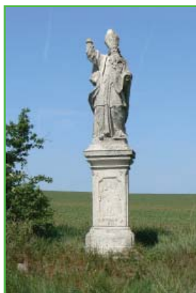
Socha sv. Gottharda před rekonstrukcí

Aktuálně intenzivně jednáme o zřízení přístupové cesty, která by umožnila veřejnosti pohodlný přístup k soše. Věříme, že se to brzy podaří, a že se socha sv. Gottharda stane dalším krásným zastavením pro všechny, kteří se vydají na procházku kolem obce.