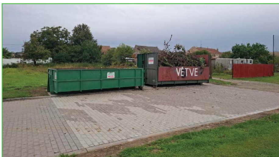
Kontejner na větve u hřiště