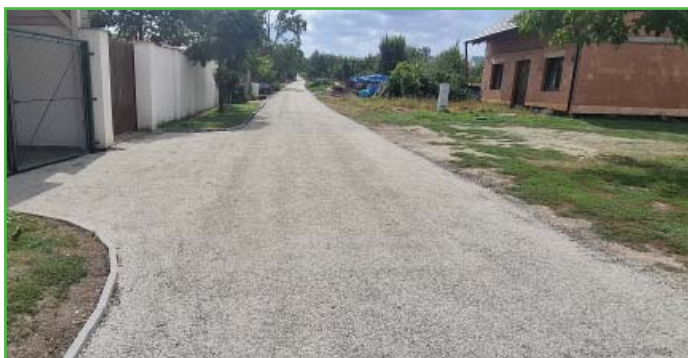
Dokončené oprava komunikace za 3. řádkem