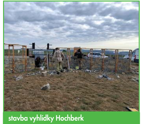
stavba vyhlídky Hochberk