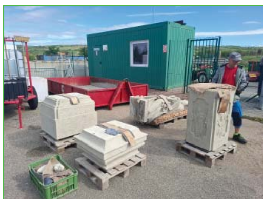
Dovoz jednotlivých dílů po restaurátorském zásahu