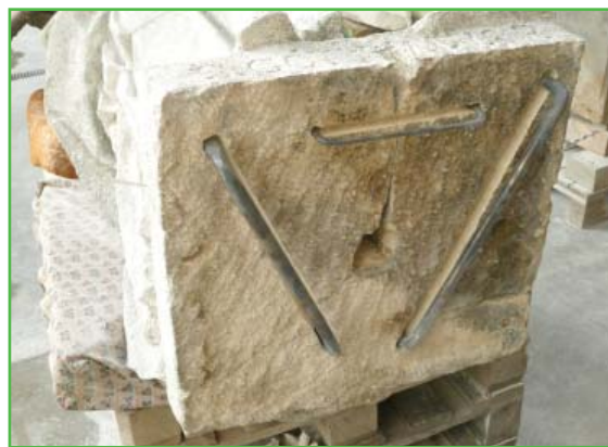
Socha v dílně pana Tůmy