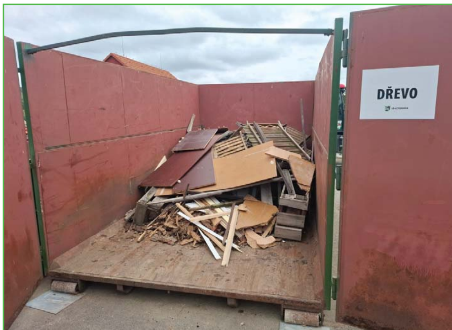
Kontejner na dřevo na sběrném dvoře