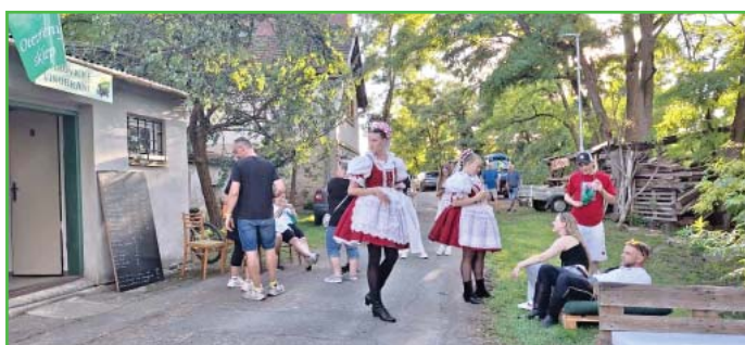
Vinaře přišli podpořit i stárci