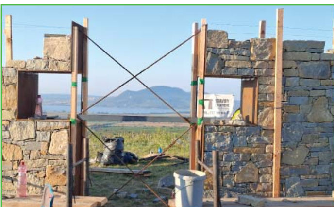
Jeden z nejhezčích výhledů na Pálavu