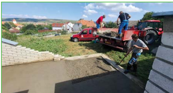
Úprava plochy na hřbitovní odpad

Kromě velké rekonstrukce obecního úřadu probíhaly na obci i jiné, menší projekty. Některé z nich jsou zachyceny na následujících fotkách.