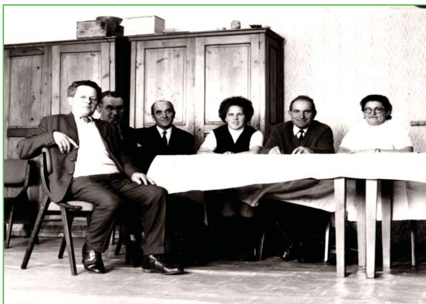
Volební komise z roku 1971

rý vkládá do úřední obálky, může přitom zakroužkováním pořadového čísla nejvýš u 4 kandidátů uvedených na témže hlasovacím lístku vyznačit, kterému z kandidátů dává přednost.