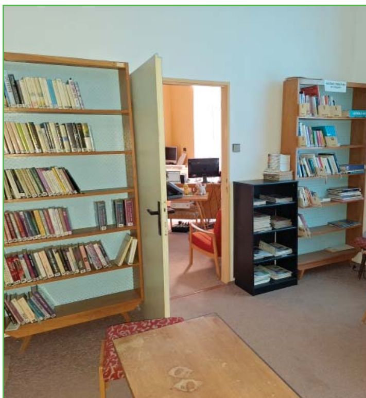
Knihovna před rekonstrukcí