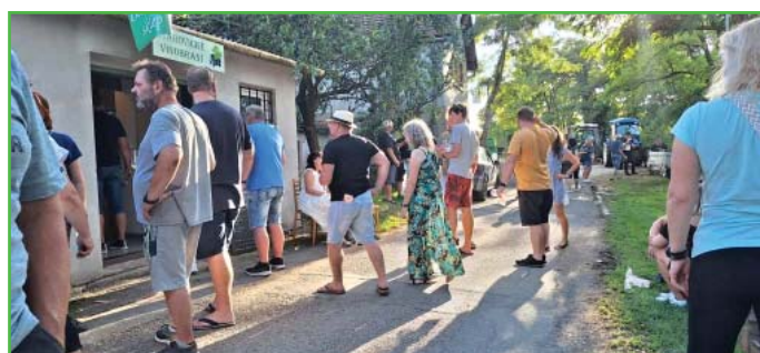
Odpoledne panovalo nádherné letní počasí