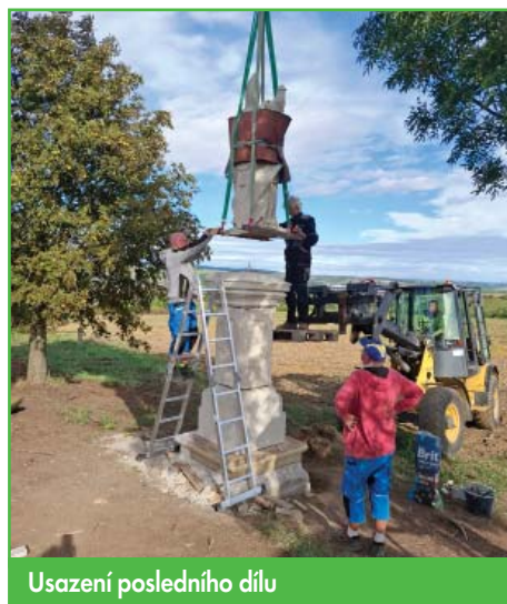
Usazení posledního dílu