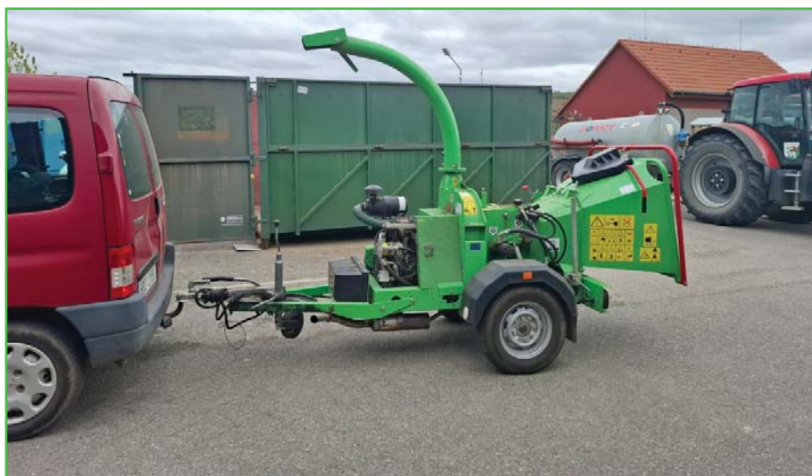
Mobilní štěpkovač na dřevo k zapůjčení