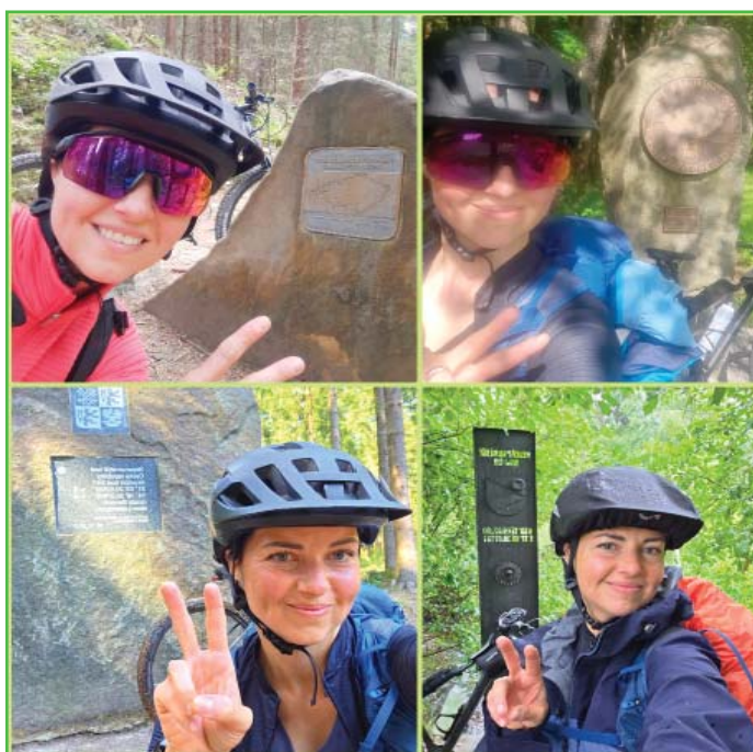
Pozdrav z cesty (nejsevernější, nejjižnější, nejzápadnější, nejvýchodnější bod ČR)