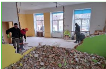
Zahájení bouracích prací v místech knihovny

Původní přestavba na kanceláře byla provedena velmi nešetrně, například příčky v místnosti bývalé třídy byly stavěny přímo na původních dřevěných parketách, což odhalila až současná rekonstrukce. Od roku 1983 až dosud byly tyto prostory ve druhém patře bez dalších oprav a údržby.