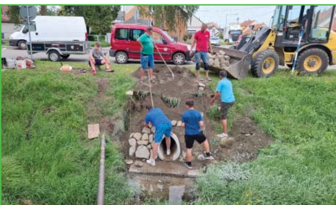
Úprava výpusti z dešťové kanalizace