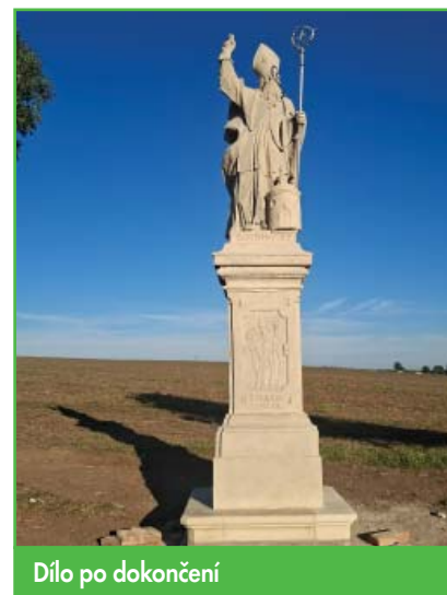
Dílo po dokončení