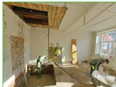
Příprava výtahové šachty

Občané budou mít možnost prohlédnout si část zrekonstruovaných prostor už při nadcházejících volbách.