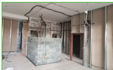
Stavba sádkartonových příček v 2.NP