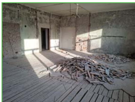
Prostory po demolici připoměly školní třídu

V roce 2000 se kanceláře obecního úřadu přesunuly z patra do přízemí. V té době byla bývalá tělocvična přestavěna na ordinaci praktické lékařky. Po covidové pandemii přestala paní doktorka už ordinaci využívat a uvolněné prostory pak sloužily pro pedikúru, kosmetiku a masáže. Další úpravou prošla budova v roce 2020, kdy jsme zrekonstruovali zasedací místnost podle návrhu designérky p. Strakové. Poslední rekonstruovanou částí vnitřních prostor byla jižní strana budovy: knihovna, archivy a spodní část bývalého zdravotního střediska. Rekonstrukci provedla na základě výběrového řízení firma Stavby Rufa z Velkých Němcic během půl roku a na konci června byla budova úspěšně zkolaudována. Celkové náklady dosáhly částky 4,37 mil. Kč. Rekonstrukcí došlo k dispoziční změně místností, byly vyměněny všechny vnitřní instalace (elektro, slaboproud, voda, odpady) a především byl vybudován výtah, který dnes patří ke standardu ve veřejných budovách. Díky rekonstrukci je obecní úřad moderní, plně bezbariérový a připravený sloužit občanům dlouhé desítky let.