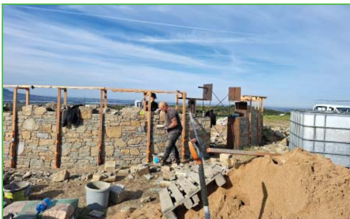
Výstavba kamenné vyhlídky Hochberg