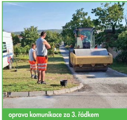
oprava komunikace za 3. řádkem

V období prázdnin se také podařilo uskutečnit dvě silniční stavby. Tou první bylo vybudování zpomalovacího retardéru na 1. řádku u fary, jakou součást dlouhodobého záměru zvyšování bezpečnosti v dopravě. Druhou stavbou byla oprava cesty za domy na 3. řádku, která po více než dvaceti letech už nutně potřebovala zásah. Stavbu provedla firma Stavba a údržba silnic a celkový náklad byl 991 tisíc Kč.