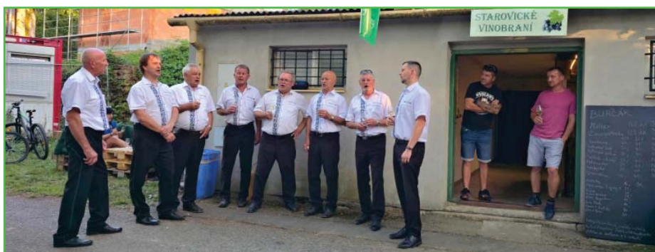
Mužáci zazpívali u každého otevřeného sklepa