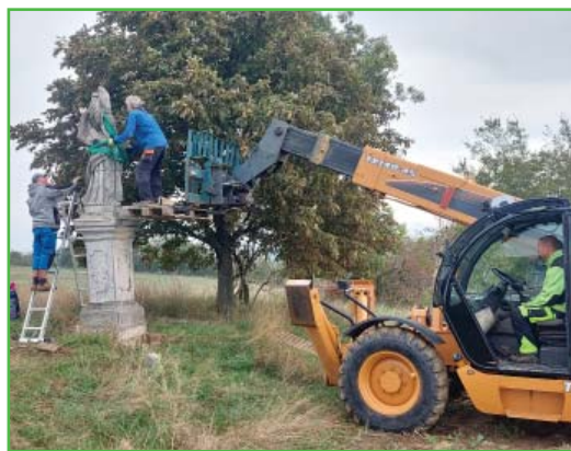
Demontáž sochy v září 2024