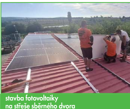
stavba fotovoltaiky na střechě sběrného dvora

Vážení občané, letošní léto svým počasím připomínalo roky, jaké mnozí z nás pamatují z dětství v 70. a 80. letech 20. století – několik horkých dnů, chladnější noci a častější bouřky s deštěm. Zatímco někomu chyběly tropické teploty, jiní, včetně mě, toto počasí přivítali s úlevou. Ani v létě se u nás práce nezastavily. V obci probíhala řada menších či větších stavebních projektů, z nichž nejvýznamnější je výstavba fotovoltaické elektrárny na sběrném dvoře o výkonu 33 kPi. Ta bude sloužit k napájení čističky odpadních vod a pomůže nám snížit energetickou závislost obce na veřejné síti. Většinu vyrobené energie spotřebujeme přímo v provozu ČOV, a proto má tento projekt, i po zkušenostech z minulých let, velký smysl. Do budoucna plánujeme další fotovoltaiky na obecních budovách – jejich realizace ale bude záviset na ekonomických možnostech a návratnosti investic.