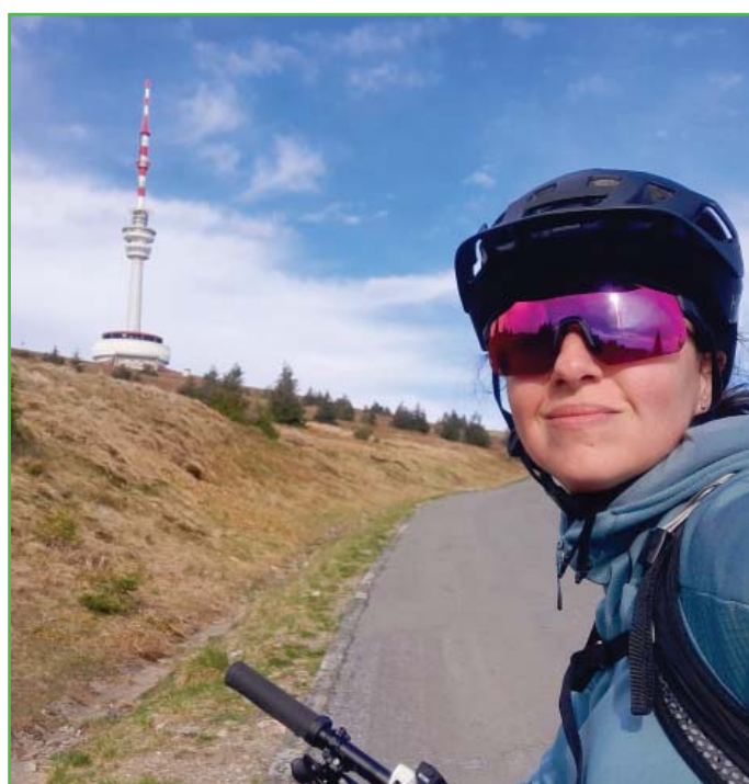
Pozdrav z Pradědu