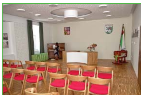
Opravená zasedačka z roku 2020

Podle dostupných informací byla současná budova postavena na začátku 60. let 19. století z podnětu faráře Roberta Hanáka jako dvoutrždní škola, na začátku 90. let 19. století pak byla rozšířena na trojtrždní. Děti se zde učily nepřetržitě až do roku 1983, kdy byla škola na základě rozhodnutí místního národního výboru z ekonomických důvodů uzavřena a žáci začali dojíždět do Hustopečí. V téže roce došlo v obci k dopravní nehodě, kdy nákladní vozidlo Tatra V3S narazilo do budovy tehdejšího národního výboru (budova dnešní hospody u kostela) a poškodilo její statiku. Úřad se proto přestěhoval do prázdné budovy školy, kde sídlí dodnes (dříve MNV, nyní obecní úřad).