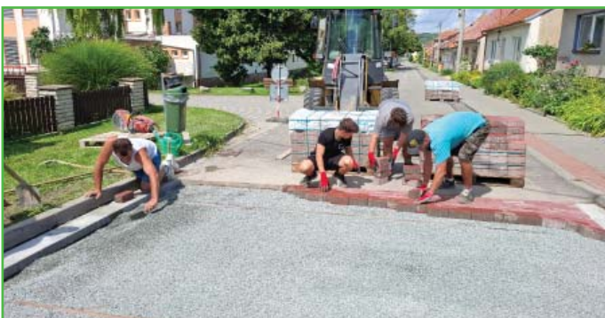
Stavba zpomalovacího retardéru na 1. řádku