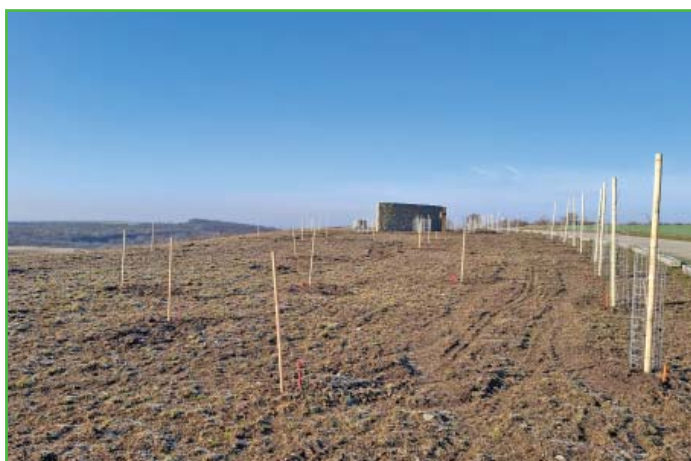
Výsadby na Hochberku.