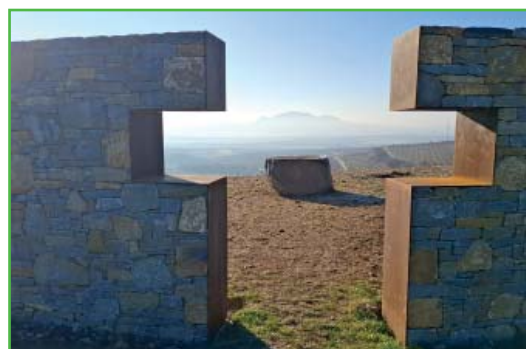
Výhlídka na Pálavu na Hochberku.