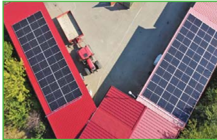
Fotopanely na sběrném dvoře.

V létě vybraná firma NOEL zahájila stavbu fotovoltaiky na střeše sběrného dvora o výkonu 33 KWp, která byla řádně dokončena a bude částečně dotovat vyrobenou elektrickou energii čistíčky odpadních vod.