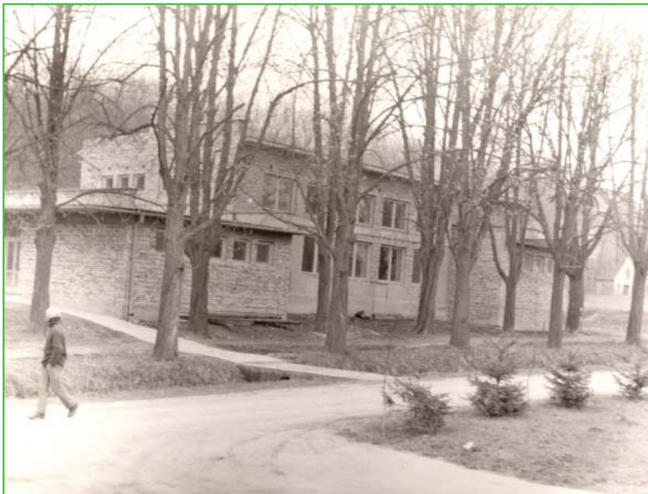
Nejdůležitějším projektem roku 1975 bylo dokončení generální opravy sokolovny.