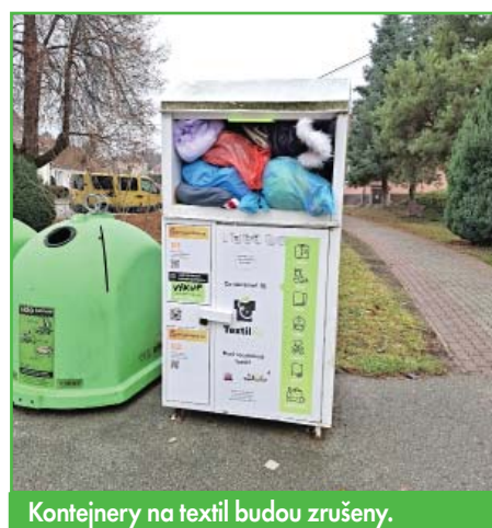
Kontejnery na textil budou zrušeny.

Důvodem je výrazné a rychlé navýšování cen za odvoz textilu. Zatímco do roku 2025 byly kontejnery vyváženy zdarma, od letošního roku platíme za 6 000 Kč ročně za každý kontejner. Pro příští rok již poskytovatel požaduje