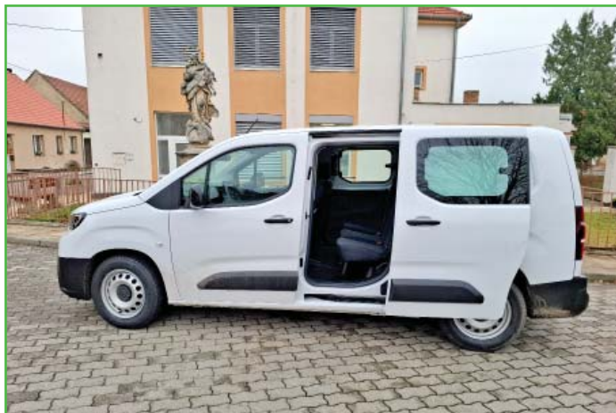
Nově pořízené elektroauto.