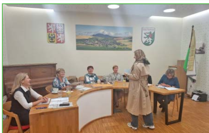
Volby se letos konaly v zasedací místnosti obecního úřadu, která je nově díky výtahu bezbariérová.