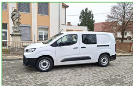
Nově pořízené elektroauto.

Z toho důvodu jsme se rozhodli pro další investice na snižování energetické závislosti, kdy připravujeme stavbu fotovoltaiky i na budovu školní jídelny, která bude přispívat na chod kuchyně, obecního úřadu a dobíjet nově pořízené elektroauto. Pořízení elektroauta vnímám jako velmi zdařilý krok, protože vozidlo v hodnotě 1,1 mil. Kč se nám podařilo pořídit za 317 tisíc Kč. Jak se to povedlo? Už vloni jsme se rozhodli nahradit 18 let starého Peugeota, kterého používají zaměstnanci obce, za nové vozidlo. To bylo začátkem roku objednáno a v červenci jsme jej měli převzít. Těsně před převzetím nás ale navštívil prodejce z Toyoty, který dojel s nabídkou elekt-