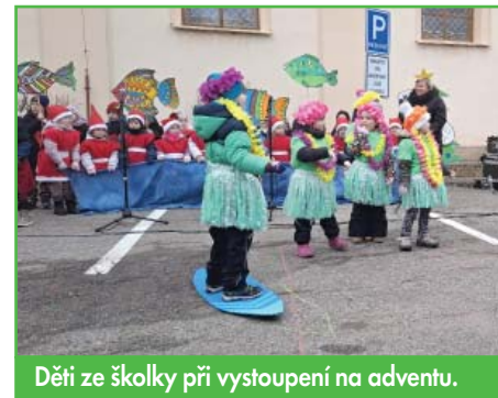
Děti ze školky při vystoupení na adventu.