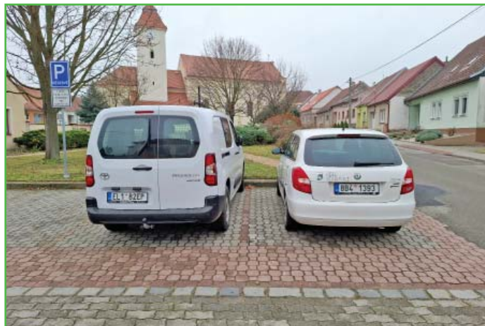
Obecní vozový park.