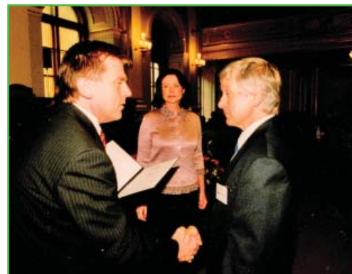
Udělení znaku předsedou Poslanecké sněmovny Ing. Miloslavem Vlčkem