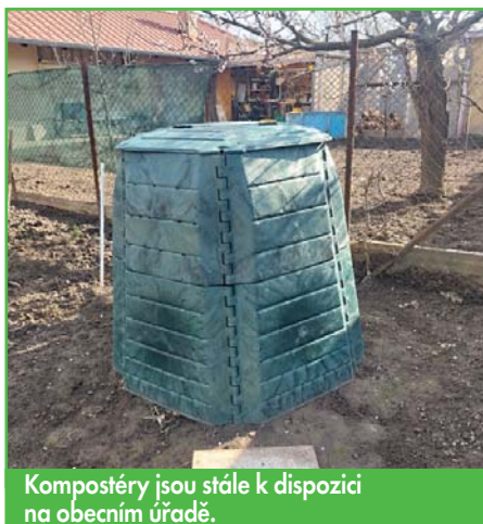
Kompostéry jsou stále k dispozici na obecním úřadě.