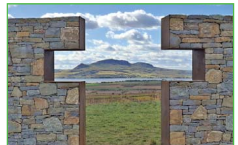
Vyhlička na Hochberku.

V podzimní části roku jsme pokračovali v úpravách, které zatraktivňují okolí naší obce. Vyhlička na Hochberku byla doplněna výsadbou podle návrhu krajinné architektky Ing. Hukové. Přestože jsme původně počítali s pomocí veřejnosti při výsadbě, blížící se konec roku a nepříznivé počasí nás donutily jednat rychle a provést výsadbu s pomocí obecních zaměstnanců. Věřím však, že se na Hochberku společně sejdem při některé z budoucích akcí, například při příležitosti požeňání místa.