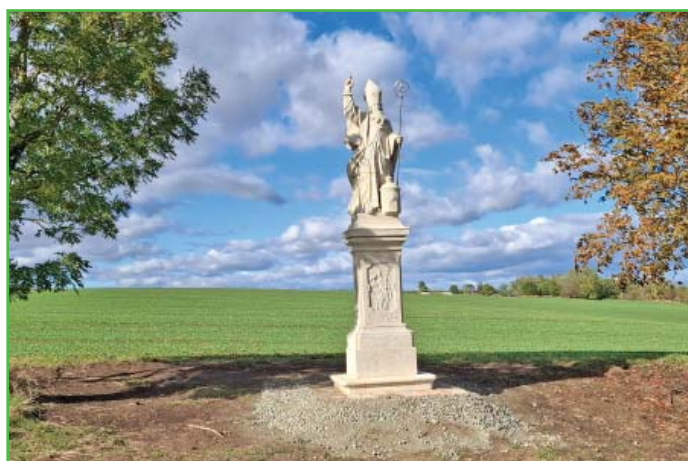
Zrestaurovaná socha sv. Gotharda.