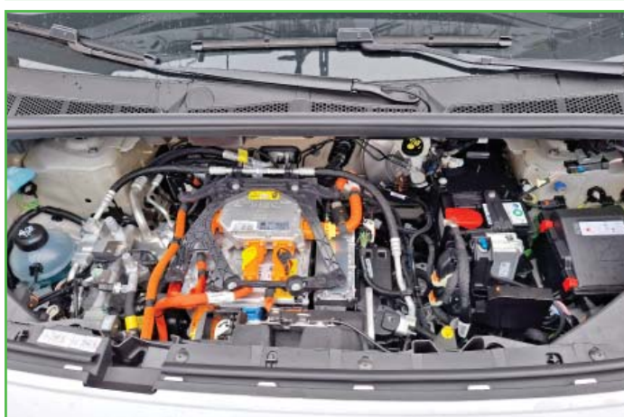
Pohled do motoru nového elektroauta.