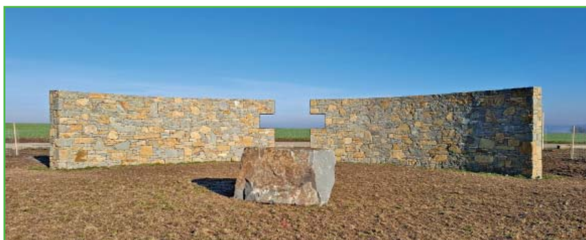
Výhlídka na Hochberku.