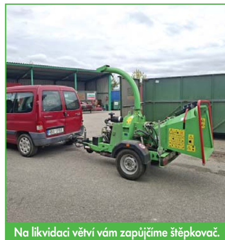
Na likvidaci větví vám zapůjčíme štěpkovač.