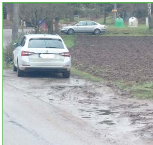
Dříve běžný obrázek, dnes bláto nahrazujeme stavbou parkovišť.