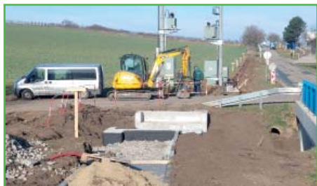
Stavba chodníku do průmyslové zóny pokračuje.

obnovy veřejného osvětlení, budování nových parkovacích stání, stavba zpomalovacích prahů v rámci celé obce a další drobné projekty.