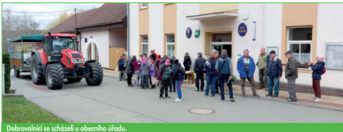
Dobrovolníci se scházeli u obecního úřadu.