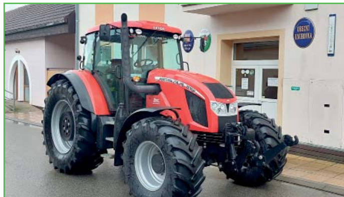
Rozšířili jsme náš vozový park o lehce ojetý traktor Zetor Forterra 150 HD za cenu 1,3 mil. Kč.