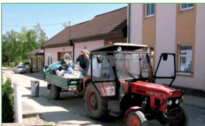
Svozy odpadů dřívě.