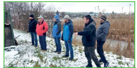
Zastupitelé při pracovní obchůzce.

Nově zvolené zastupitelstvo v mírně obměněném složení navázalo na svoji předchozí činnost a na pracovní poradách si stanovilo krátkodobé i střednědobé cíle pro následující čtyři roky v rozvoji obce.