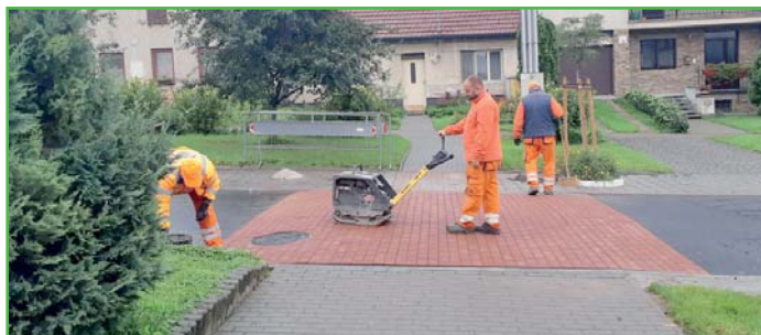
Jeden z nových silničních retardérů, který plní svůj účel.