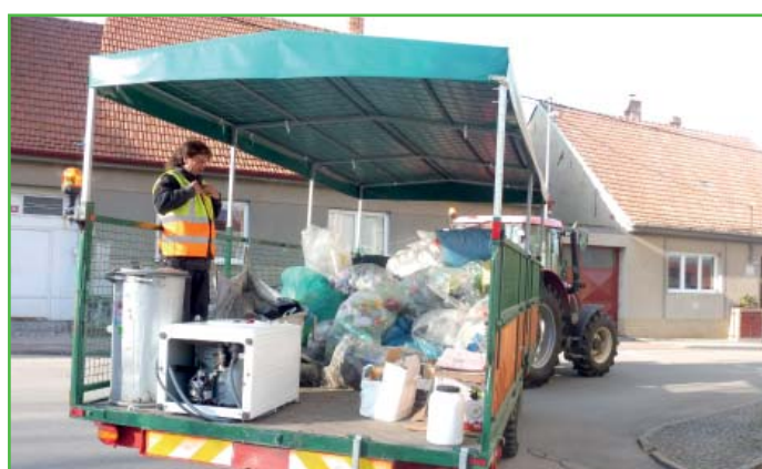
Svozy odpadů dnes.