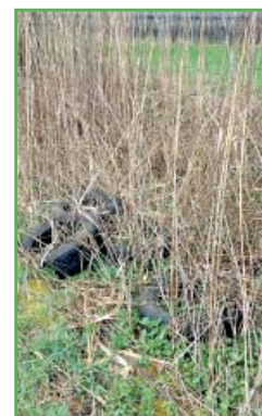
V mezi vyhozené pneumatiky.