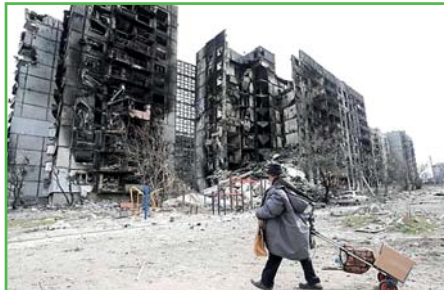
Lidé na Ukrajině aktuálně musí řešit jiné věci než my.

zvítězil, a to i v porovnání s výsledky všech předchozích přímých voleb prezidenta, kdy zaznamenal nejvyšší rozdíl v hlasech mezi vítězem a poraženým, Petr Pavel s 58,32 %, což představuje téměř o milion hlasů více, než získal Andrej Babiš. Prezidentské pravomoci u nás nejsou vysoké, prezident nemůže zvýšit důchody ani poslat svévolně vojáky do války, jak nám někteří populisté a dezinformátoři podsouvali, ale může zklidnit rozbouřenou atmosféru ve společnosti a svým příkladem vést občany ke slušnému dialogu a chování. Na to, jak se bude dále vyvíjet ekonomická situace v Evropě i na celém světě, od které se odvíjí do značné míry atmosféra mezi lidmi, má daleko větší vliv válka na Ukrajině. K lepšímu životu a naději stačí jedině, aby Putin ukončil agresi na Ukrajině, a v tu chvíli bude na celém světě o něco líp.