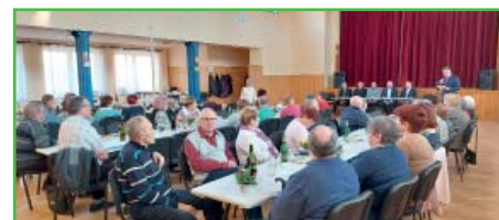
Setkání se seniory.

Po tříleté pauze jsme také zorganizovali setkání pro seniory v místní sokolovně. Bohužel dlouhá přetržka měla za následek, že si naši starší občané odvykli chodit na akce, a setkání se zúčastnila jen asi polovina seniorů. Ale ti, kteří si udělali čas, určitě nelitovali, protože se dozvěděli spoustu zajímavých věcí z dění v obci, zhlédli krásné vystoupení dětí z mateřské školky a mohli strávit hezké odpoledne se svými vrstevníky.