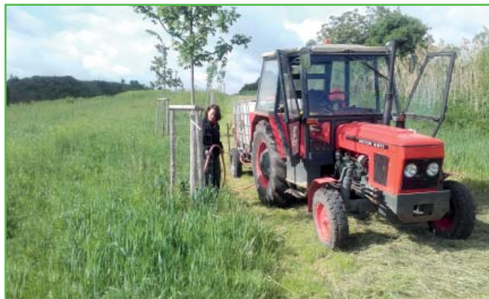
Starý Zetor 6911 nabízíme k prodeji za cenu 170 tis. Kč.

Náš obecní „vozový park“ jsme rozšířili o nový traktor. Na následujících fotkách si připomeňme, jaké stroje naši zaměstnanci používali ještě nedávno a jak se nám doba proměnila.