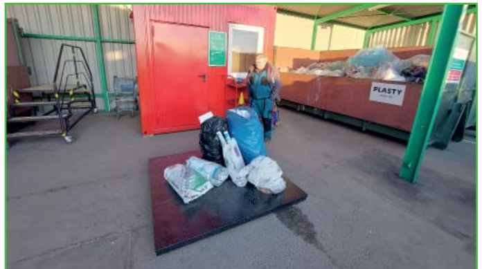
Vážení odpadů na SDO

Vytříděné odpady jsou zdarma: plast, sklo, papír, kov, dřevo, elektro.