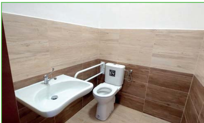
V sokolovně máme nově bezbariérové WC.