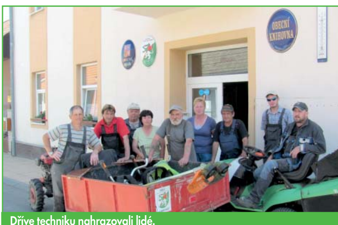
Dřívě techniku nahrazovali lidé.