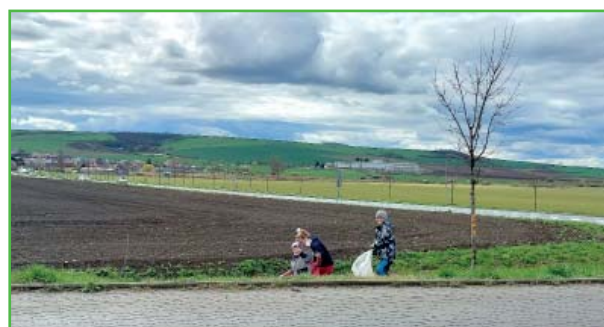
Sbírání odpadků poblíž autobusové zastávky u hlavní silnice.