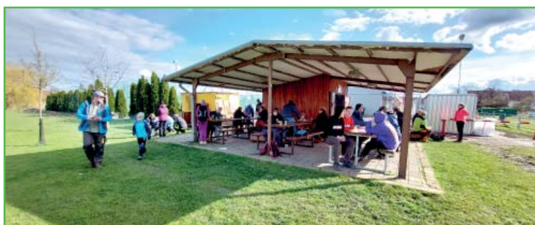
Na konci byli účastníci odměněni drobným občerstvením i slunečními paprsky.