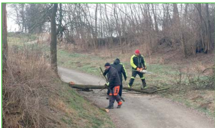
Údržba cest a zajištění průjezdnosti.