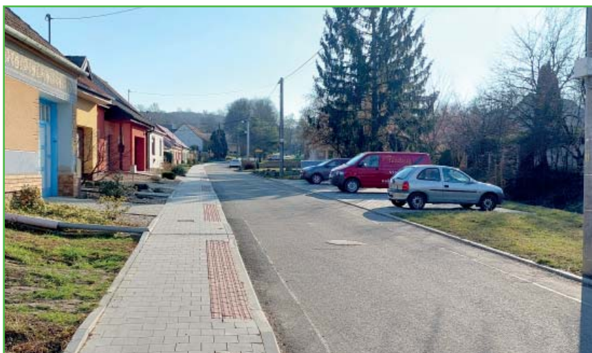
Auta na parkovištích umožňují průchozí chodníky.