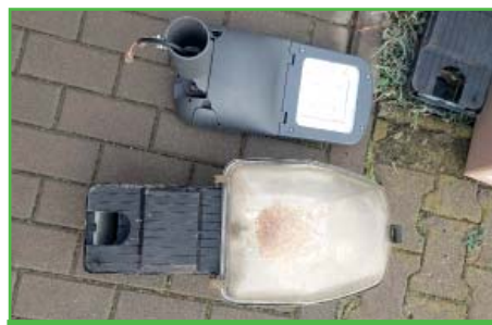
Porovnání nových LED světel se starým světlem.

Hned začátkem roku po obdržení dodávky svítidel jsme přistoupili k avizovanému šetření energií formou výměny svítidel veřejného osvětlení za nová LED svítidla. Vyměněna byla prozatím světla kolem hlavní silnice III. třídy od křižovatky na Uherčice, na čtvrtém řádku a v celé horní části obce kolem sokolovny. Došlo k výměně více jak 50 % všech svítidel a zbytek obce chceme zrealizovat co nejdříve,