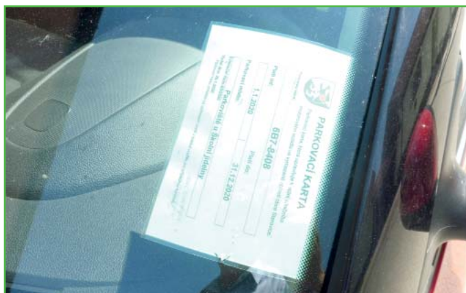
Řádně označené auto parkovací kartou.