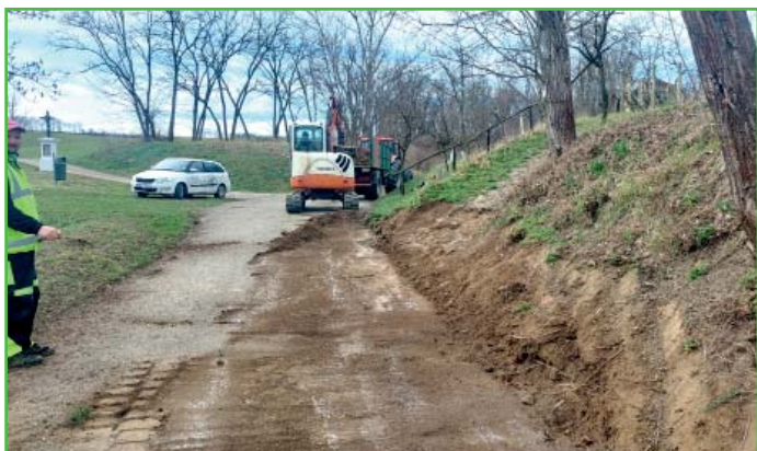
V zimním období provádíme údržbu účelových komunikací.