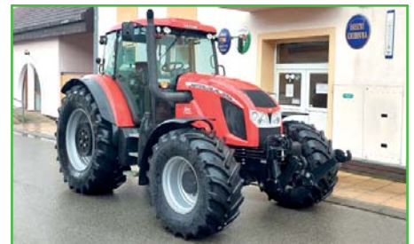
Nově pořízený traktor Zetor 150 HD.

Rok 2022 byl ekonomicky velmi turbulentní a díky energetické krizi velice nejistý, ale i přesto jsme zrealizovali mnoho investičních akcí, jako například chodník na 1. řádku, přístavbu sokolovny, pořídili jsme nový traktor Zetor Fortera 150 HD a skončili jsme hospodaření naší obce s přebytkem 744 tisíc Kč.