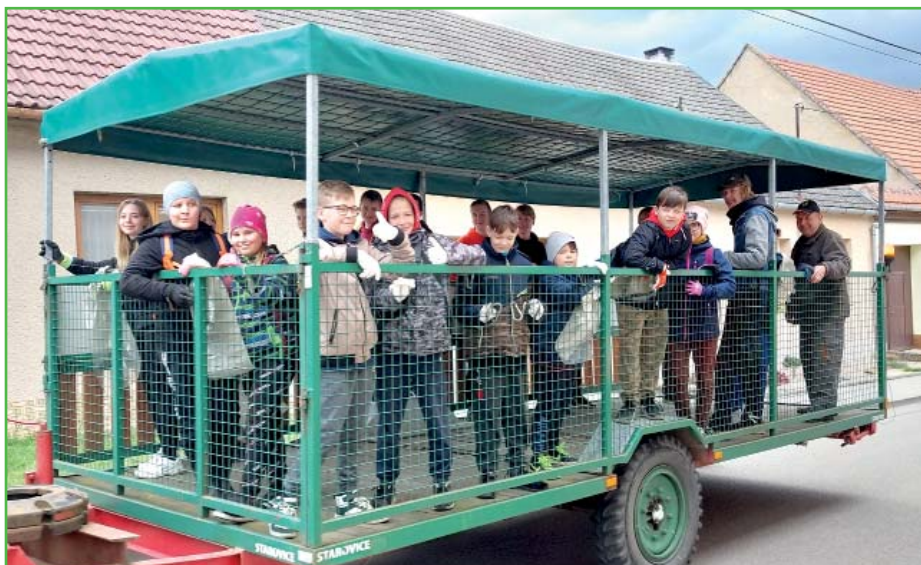
Děti oblíbené svezení na vlečce.