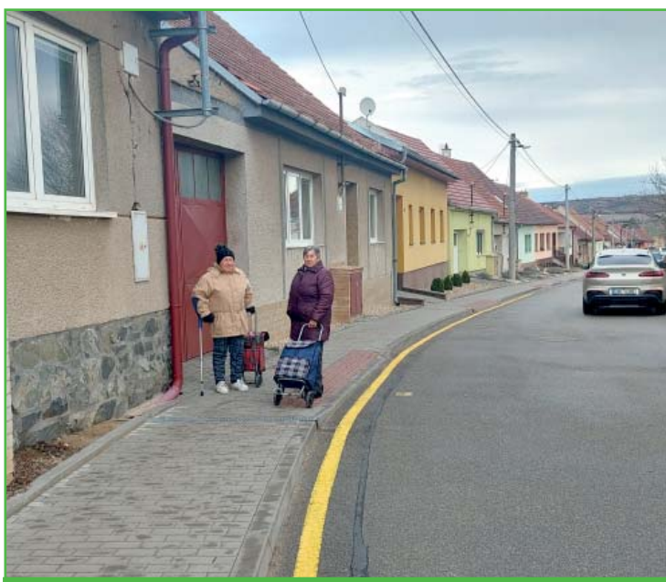
Nechte chodníky volné pro chodce, ne všichni jezdí autem.