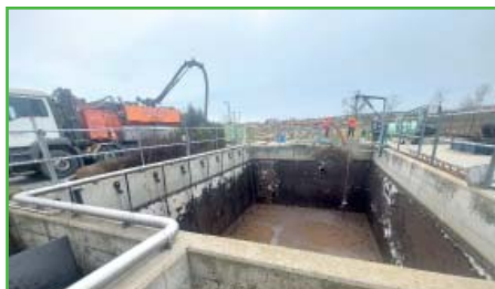
Nákladná údržba čistírny odpadních vod.

Mezi plánované investice patří stavba fotovoltaiky na budovu školní jídelny, kde jsme již pořídili za dosluhující plynové spotřebiče nové elektrické, které bychom chtěli napájet právě fotovoltaikou, abychom snížili energetickou náročnost provozu. Také pracujeme na projektu fotovoltaiky pro čistírnu odpadních vod, kde máme vysokou spotřebu energií a kde odhadujeme náklady na energie pro letošní rok kolem 600 tisíc Kč.