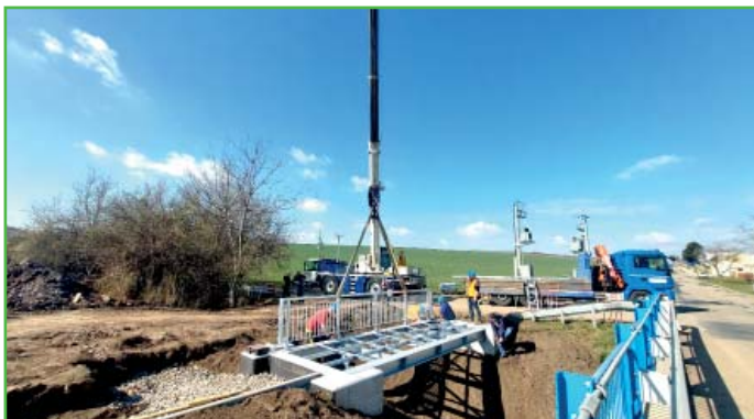
Stavba chodníku do průmyslové zóny úspěšně pokračuje, už je usazen nový mostek.