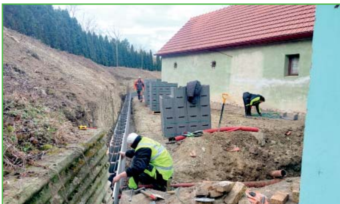
Zaměstnanci obce při úpravě areálu u myslivny.