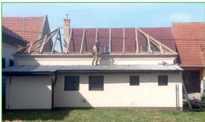
Také mlíčárna se konečně dočká nové střechy.