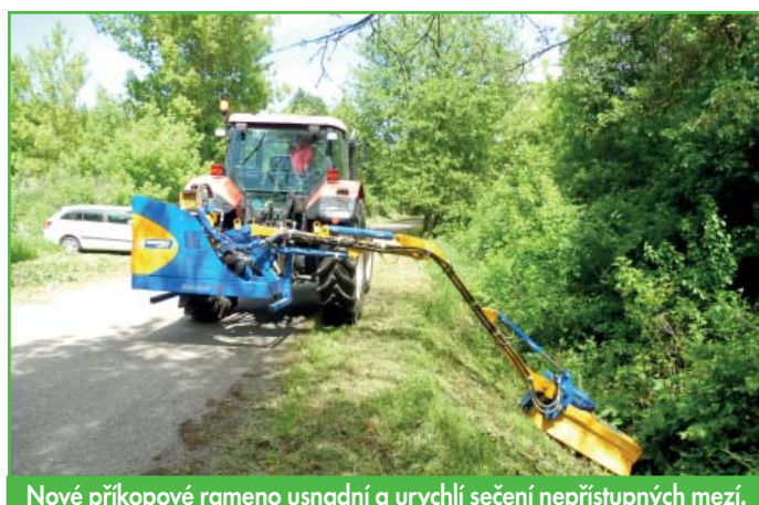
Nové příkopové rameno usnadní a urychlí sečení nepřístupných mezí.