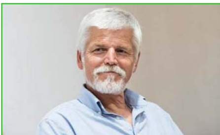
Petr Pavel - nový prezident.

Vážení občané, začátek tohoto roku proběhl ve znamení volby nového prezidenta naší republiky. V prvním kole voleb jsme vybírali z osmi kandidátů, ze kterých do druhého kola postoupil občanský kandidát Petr Pavel a stranický kandidát hnutí ANO Andrej Babiš. Každé volby s sebou nesou emoce, každá strana hájí svého kandidáta, ale letošní volby prezidenta byly enormně vyhrocené. Střetli se dva kandidáti odlišných hodnot a naše společnost, která je rozdělena již tématy covidu, očkování, ruské agrese na Ukrajině apod., zaznamenala další prohloubení příkopů a nepochopení. Vyhrocená atmosféra před volbami měla za následek rekordní počet voličů, kteří došli do druhého kola voleb. Celkem to bylo 70,25 %. Ve Starovicích byla účast ještě mírně nad celorepublikovým průměrem s 71,90 %, ale na rozdíl od celorepublikového výsledku, výsledku Jihomoravského kraje i drtivě většiny okolních obcí u nás zvítězil Andrej Babiš, který získal ve Starovicích 55,57 % odevzdaných hlasů. V celé republice suverénně