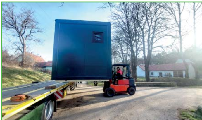
Nově pořízené sociální zařízení pro areál u myslivny.

Ani v zimním období nezahálíme, mírná zima umožňuje vykonávat různé stavební i údržbové práce.