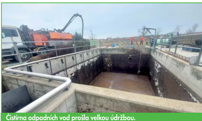
Čistiřna odpadních vod prošla velkou údržbou. Vaše odpady si bereme na starost.