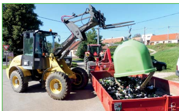
Zajištění svozů vlastní technikou šetří velké peníze.