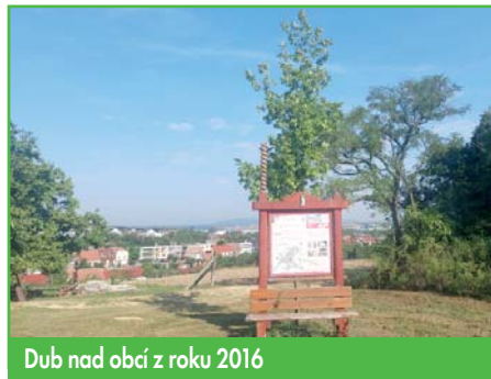
Dub nad obcí z roku 2016

Zaměstnanci obce mimo zajišťování návozu materiálu při výše uvedených stavbách se díky deštivému počasí a rychle rostoucí vegetaci museli věnovat více sečení trávy, údržbě zeleně a úklidu obce. Více mne mrzí, že jsme nestihli včas a dostatečně ošetřit stromy napadené houbovou chorobou moniliniovou spálou, které nám postupně prosychají a odcházejí. Nemoc se projevila na višních, kdoulích i hlozích. Uvidíme, zda se nám podaří stromy zachránit, anebo zda je budeme muset postupně obnovit za odolnější druhy. S globálním oteplováním přicházejí nové choroby i paraziti a nám nezbyvá nic jiného, než se změně klimatu postupně přizpůsobovat. Ostatním stromům se daří dobře. Z toho mám velkou radost a věřím, že nejen já.