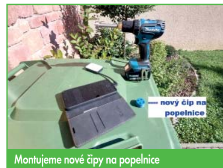
Montujeme nové čipy na popelnice