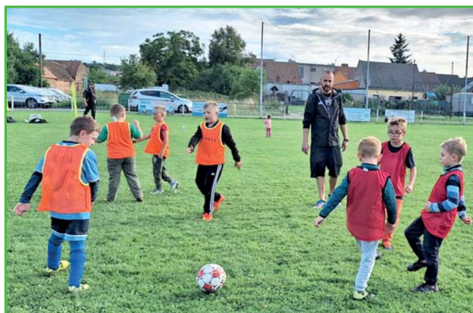
Děti si na tréninku i popovídají

Tréninky mají děti každou středu a pátek. Mladší děti z přípravek mají tréninky - středa Starovice a pátek Horní Bojanovice. Starší žáci trénují jen v Horních Bojanovicích. Nyní mají již děti za sebou tři soutěžní zápasy.