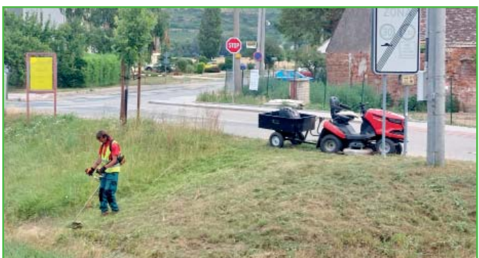
Stále se opakující sečení zeleně