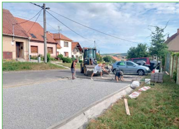
Výstavba nových parkovacích míst na 3. řádce