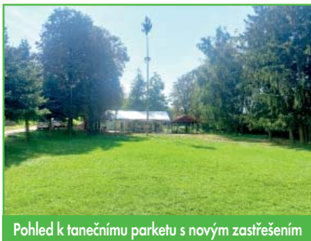
Pohled k tanečnímu parketu s novým zastřešením