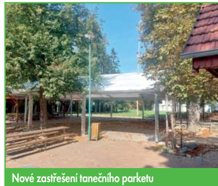
Nové zastřešení tanečního parketu