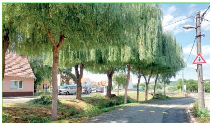
Vrby dostaly nový sestřih