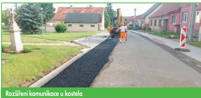
Rozšíření komunikace u kostela