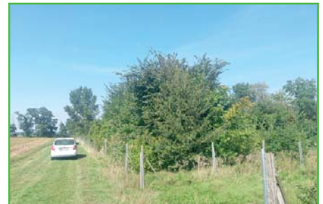
Biokoridor vysazený v roce 2015

zpomalovacích silničních retardérů, výsadbě nových stromů a výsadbě stromořadí kolem nového chodníku směrem k průmyslové zóně na Uherčice. V oblasti životního prostředí máme rozpracováno několik projektů především v extravilánu obce. Jde např. o osázení travnatých pásů v polích mezi obcí a městem Hustopeče, pokračování ve výsadbě biokoridoru kolem cesty nad lesíkem nebo dosažení biocentra směrem ke střelnici. Tyto projekty řešíme postupně tak, abychom byli schopni je udržovat.