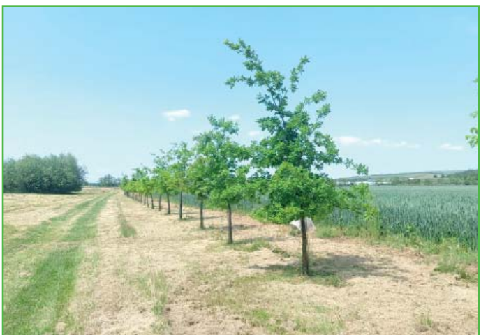
Takto krásně se daří zeleni v biokoridoru za rybníkem