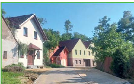
Nová vozovka mezi sklepy

V obci jsme se v tomto období věnovali menším, dlouho odkládaným stavbám, jako rozšíření parkovišť, sběrných míst odpadů, rozšíření komunikací, prostě stavbám, které zlepšují bezpečnost a každodenní život v obci. Poté, co majitelé sklepů na 2. řádce na své náklady zbudovali nový vodovod, dešťovou a splaškovou kanalizaci, obec postavila novou komunikaci. Tato sklepní část má dnes nové inženýrské sítě a předpokládáme, že vydrží na dlouhou dobu. Především díky soukromé investici je tato sklepní část dnes reprezentativní a můžeme se jí pochlubit i návštěvníkům vinařské turistiky.