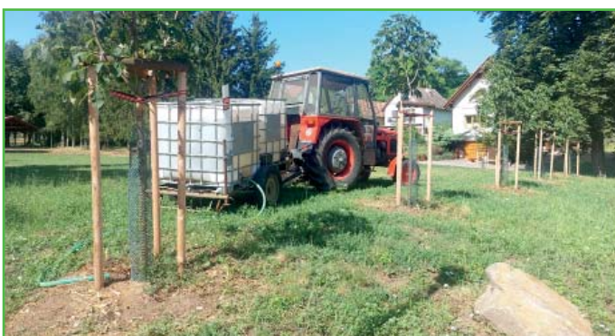
Zálivka nových stromů