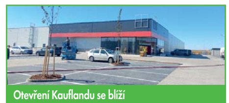
Otevření Kauflandu se blíží

Dobrou zprávou pro občany využívající Zásilkovnu u obchodu je, že z důvodu velkého využívání Zásilkovna rozšíří Z-BOX na dvojnásobnou kapacitu. Je zajímavé, že Česká pošta postupně ruší své služby, a soukromé společnosti v této oblasti prosperují. Mnoho občanů, především těch starších, netrpělivě čeká na otevření Kauflandu, který bude slavnostně otevřen 25. 10. 2023, a tak místo klasického nákupního dvojboje Penny - Lidl přibude pro mnohé trojboj s Kauflandem navíc.