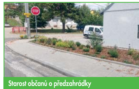
Starosta občanů o předzahrádky