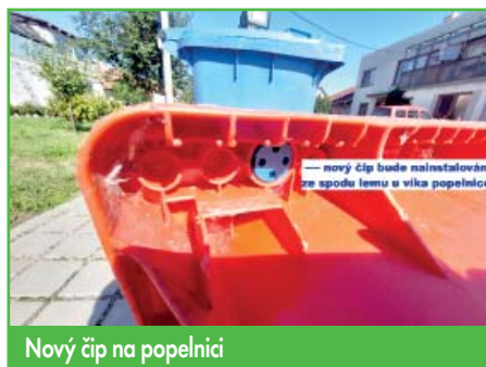
Nový čip na popelnici

ré jsou na hraně své životnosti, aby je nahradili novými, plastovými popelnicemi. Důvodem je, že čipy na kovové popelnice se náročněji instalují a tyto čipy jsou i výrazně dražší. Obecní úřad nabízí plastové popelnice 120 l za pořizovací cenu 938 Kč.