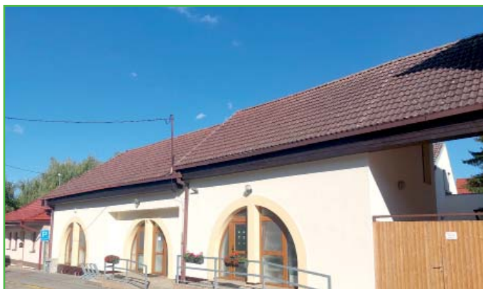
Školní jídelna s novou fasádou