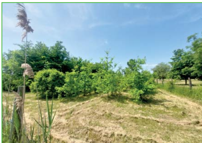
Biokoridor za rybníkem