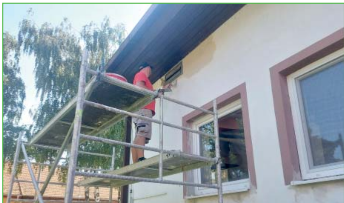
Školní jídelna už si také zasloužila nový kabát