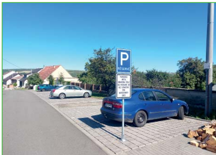
Systém parkování nám v ostatních obcích můžou závidět

Jaké bylo léto očima obecních zaměstnanců? Prohlédněte si fotodokumentaci obecních činností v uplynulém čtvrtletí.