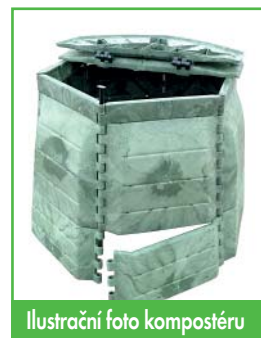
Ilustrační foto kompostéru

Neustále se snažíme hledat řešení ke snížení objemu odpadů a dalším krokem je usnadnit jednotlivým domácnostem likvidaci bioodpadu přímo doma. Z toho důvodu pořídila obec s využitím dotačního programu 250 kusů kvalitních kompostérů o objemu 1100 l, které budeme nabízet jednotlivým domácnostem. Tento způsob likvidace bioodpadů považujeme za neefektivnější a neekologičtější. Hnědou popelnicí, jak ji používají některé obce, považujeme za velmi drahé a neekologické řešení vhodné spíše pro města, u nás je mnohem přirozenější zlikvidovat bioodpad tam, kde vznikl, a vrátit živiny do půdy. Jakmile nám vybraný výrobce dodá kompostéry, budeme vás informovat o způsobu převzetí. Tuto informaci sdělujeme dopředu, abyste s tím mohli počítat.