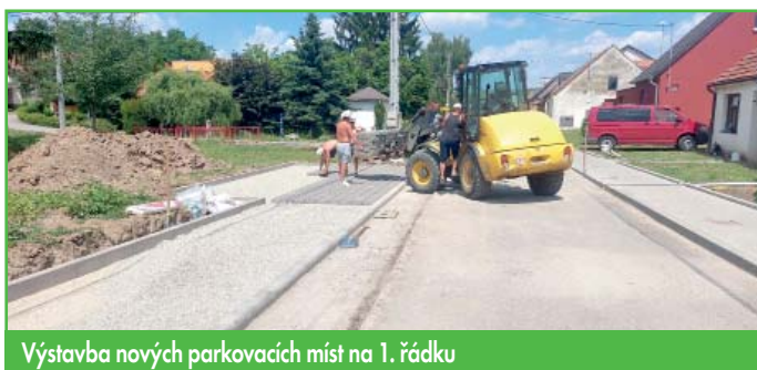
Výstavba nových parkovacích míst na 1. řádce