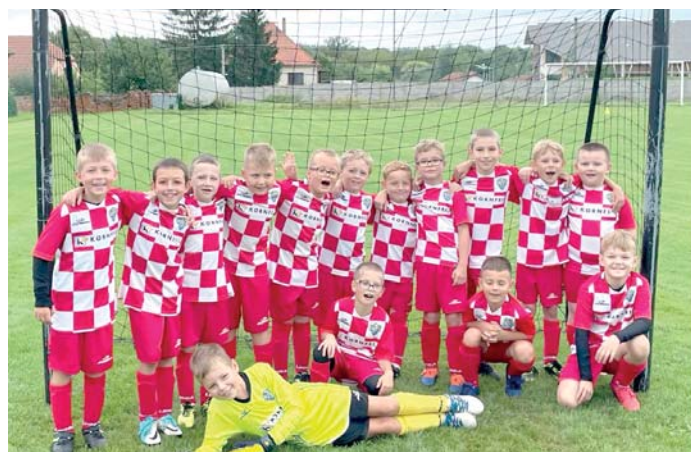
Mladší příprava 2023