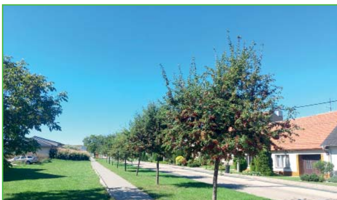
Pohled na udržovanou zeleň