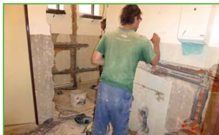
Rekonstrukce soc. zařízení v budově jídelny

Mimo staveb řešených dodavatelsky jsme zrealizovali v tomto období mnoho menších staveb s využitím místních živnostníků a našich pracovníků. O prázdninách jsme se dali do úpravy sociálního zařízení ve školní jídelně, kdy jsme sociálku přestavěli na bezbariérové a před jídelnou jsme také vytvořili bezbariérový vstup.