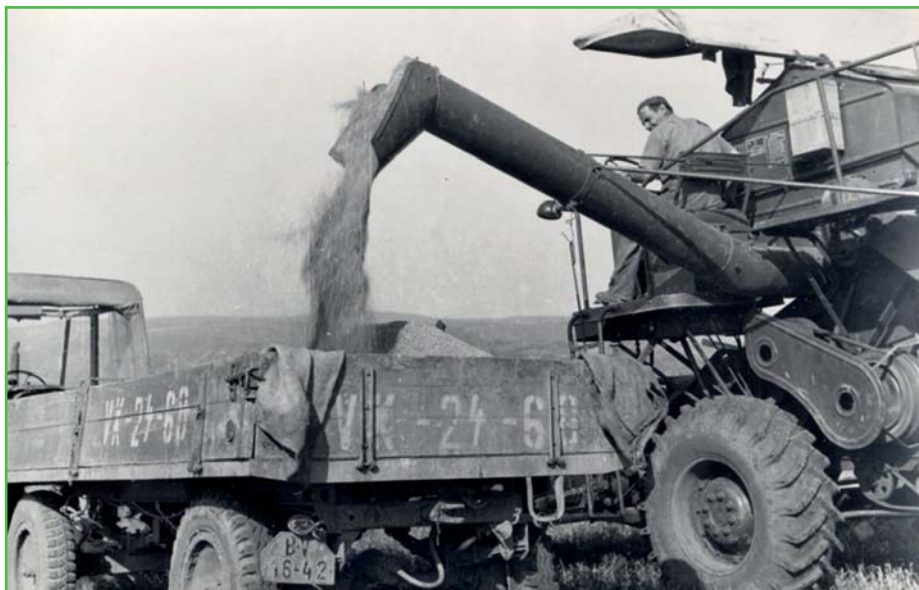
Žně v roce 1965

„Konečně při žňové práci pochopili družstevníci velký význam mechanizace a zklýzeli obilí kombajny, které si sami na různých místech zamluvili. Tyto pracovali tak, že nestačili traktoristé odvázet obilí na polní mlat, který byl letos hodně rozšířen a kde byla postavena také sušička a sušilo se obilí ve dne i v noci.“ Při sklizni se tehdy pracovalo na 3 směny, aby bylo obilí co nejrychleji pod střechou a v čase největšího náporu žňových prací musela být dokonce požádána o výpomoc zemědělská škola z Hustopečí. Kronikář také konstatuje, že družstevníci měli dlouhou dobu z mechanizace obavy – báli se, že pokud práci zastanou stroje, přijdou o práci oni.