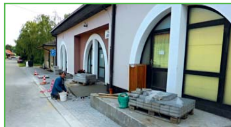
Stavba bezbariérové rampy u školní jídelny

řely nepříjemnou překážku. Navíc vybudování bezbariérových objektů na trase 2. řádku nám zvyšuje šanci na získání dotace na realizaci bezbariérového chodníku na 2. řádku od autobusové zastávky po obchod COOP, pro který v současné době připravujeme projekt a žádost o dotaci.