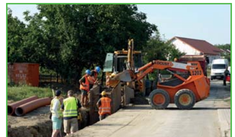
Stavba inženýrských sítí na 0-tém řádku

Se začátkem prázdnin se naplno rozjely práce na stavbě inženýrských sítí na 0-tém řádku, které provádí firma IS Hodonín. V současné době je uložena nová kanalizace dešťové vody včetně přípojek, vodovodního řádu, přípojek splaškové kanalizace a dešťových vpustí, takže stavitelé budou mít možnost se napojit na inženýrské sítě a věřím, že stavba podpoří další výstavbu rodinných domů v této lokalitě. Celková investice do inženýrských sítí přesáhla 1,6 mil. Kč a obec schválila finanční příspěvek jednotlivých stavebníků na tuto stavbu formou obecně závazné vyhlášky. Pro tuto lokalitu byla také schválena územní studie, která předepisuje základní pravidla výstavby (stavební čáru, vzhled domu, sklon střech, použití materiálů), aby nebyla ulice narušena nevhodnými stavbami. Jestliže se chystáte k výstavbě, předem se seznámete s územní studií, abyste předešli následným komplikacím s povolením stavby.