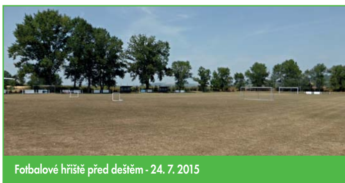
Fotbalové hřiště před deštěm - 24. 7. 2015