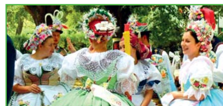
Foto z akce Setkání přátel jižní Moravy

Ke společenskému životu v průběhu letních prázdnin slouží zábavy Myslivecká noc a Hody, které zaznamenaly rekordní návštěvnost 1200 návštěvníků. Jedinou nevsední událostí letošních prázdnin bylo konání Setkání přátel jižní Moravy, kterou organizovali představitelé internetové komunity I love Jižní Morava. Myšlenka setkání byla velmi dobrá, ale první ročník se setkal s organizačními chybami a špatným marketingem, který přispěl k malé návštěvnosti. I přesto se v naší obci sešlo více jak sto krojovaných z okolních obcí a naši občané měli možnost prohlédnout si krojované při průvodu obcí. Navzdory malému zájmu návštěvníků byly ti, kteří došli, i organizátoři spokojeni a chtějí v započaté akci pokračovat také v dalším roce. Věřme, že příští ročník navštíví více návštěvníků a cestu na akci si najdou i naši občané.