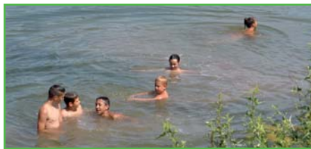
Rybník využily děti i ke koupání

malý přítok do rybníku nás nemile překvapil a způsobil zarůstání rybníku rákosem. Letošní rok byl extrémně suchý a nedá se z něj dělat závěr, jak to bude vypadat s rybníkem dál. Z nedostatku vody v rybníce jde také dobře vidět, že byl rybník dříve napájen velkým množstvím odpadních vod, což po stavbě ČOV už není. Je potřeba si položit otázku, co je lepší, zda mít rybník plný odpadní vody, nebo vody méně a čisté. Nechci říct, že nám tento stav vyhovuje, stále hledáme řešení, jak získat vodu do rybníka a zbavit se rákosu, ale ujišťuji Vás, že to není snadné. Naše návrhy vždy narazí na nesoulad s některou organizací, která má právo se k našemu projektu vyjadřovat. Ať už je to Povodí Moravy, Agentura ochrany přírody nebo odbor životního prostředí. I přes to, že není rybník plný vody, přes léto zde našlo útočiště plno živočichů. Kolem rybníka byly vidět úzovky obojkové, skokani zelení, bylo tam malé hejno čejek chocholatých, několik kachen divokých, spousta konipasů bílých ale taky několik konipasů lučních (chráněný druh) a slípka zelenonohá se třemi malými mláďaty.