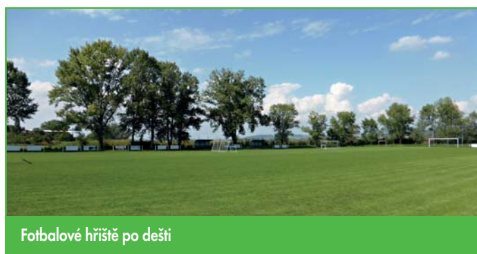
Fotbalové hřiště po dešti