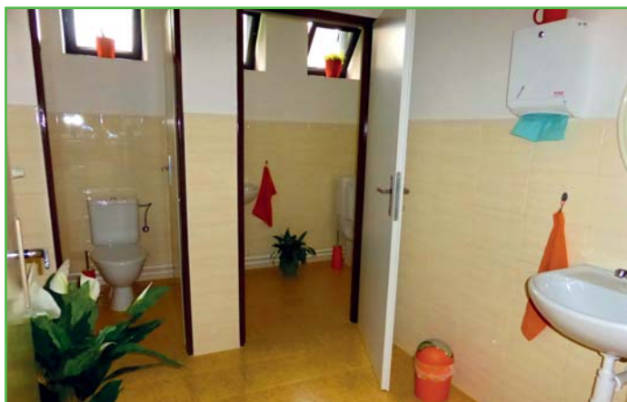
Školní jídelna - dokončená rekonstrukce bezbarierového WC