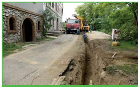
Stavba kanálu na 2. řádku sklepů

V měsíci září jsme také schválili vybudování části povrchové kanalizace na 2. řádku sklepů, v místech kde docházelo k shromažďování dešťové vody a vsakování do svahu, čímž docházelo k oslabení stability svahu. Stavbu provedla dodavatelsky firma IS Hodonín za nabídkovou cenu 164 tis. Kč.