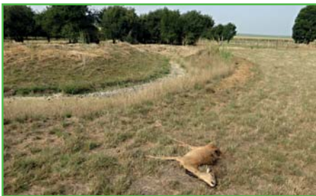
Sucho v obci

Vážení občané, činnost a život v uplynulém letním období výrazně ovlivnilo tropické počasí. Statistické údaje se předháněly, kolik let zpět už nebylo takové teplo. Potok v obci téměř vyschnul, zastavil se přítok vody do rybníka, studny snížily své hladiny a začaly schnout nově i dříve vysázené dřeviny. Tropické počasí také snižovalo pracovní aktivitu a rozpálené domy nám nedovolily si ani přes noc odpočinout. Velké sucho znamenalo přírodu a zemědělskou úrodu. Pro obec došlo sucho v roce, kdy se nám to nejméně hodilo, protože nám poschla velká část vloni vysázených biokoridorů.