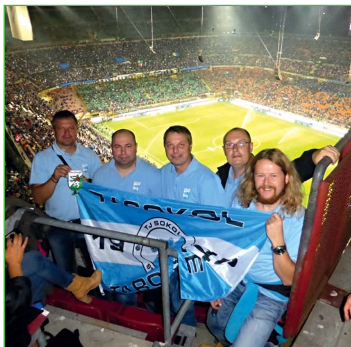
Panter na stadioně San Siro