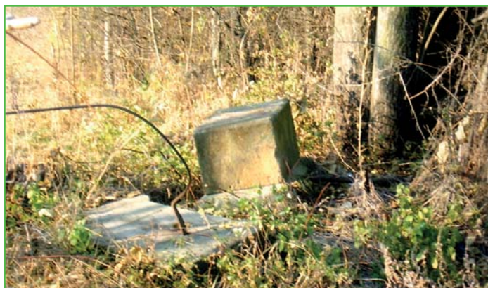
Kříž nad dálnicí před opravou