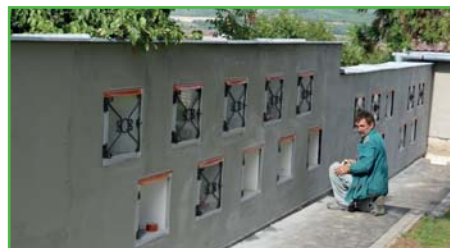
Oprava hřbitovní zdi

S pomocí místního živnostníka Antonína Švestky jsme také přistoupili k opravě popraskané hřbitovní zdi, kde jsou umístěny niky. V zimním období máme dále v plánu opravit i jednotlivá dvířka a připravit ozdobné svícny k jednotlivým níkám, proto vyzývám všechny nájemce ník, aby už nepřidávali žádné ozdoby na hřbitovní zed.