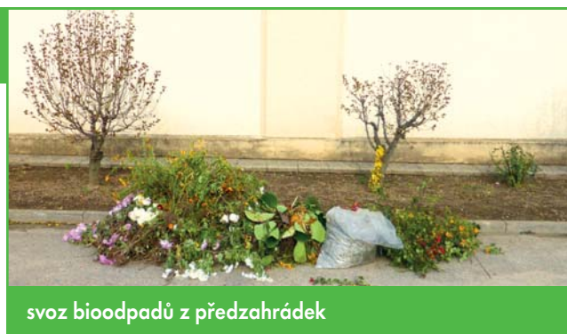
svoz bioodpadů z předzahrádek

Podzim je také obdobím sběru hroznů, ze kterých vinařům vzniká velké množství bioodpadů. Bohužel ne všichni vinaři s tímto odpadem příkladně nakládají, mnohokrát jsem viděl výlisky z hroznů v mezích u cesty a na podzim pravidelně začíná zapáchat potok v obci, protože do něj někteří vinaři vypouštějí kaly. Přitom se dají odpady z hroznů jednoduše a levně zlikvidovat. Jedná se o přírodní hnojivo, která můžete rozvést po svých polích, případně vinný kal mů-