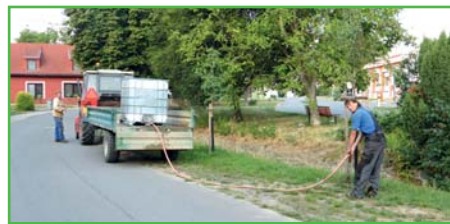
Obecní pracovníci při zalévání stromů

Obecní pracovníci se starali o naši zeleň, kdy jsme z důvodu sucha nemuseli tolik sít, ale na druhou stranu jsme museli opakovaně zalévat stromky. I přes časté zalévání nám některé i víceleté stromy uschly. Věřme, že tropické teploty letošního roku byly výjimkou a ne pravidlem pro další roky.