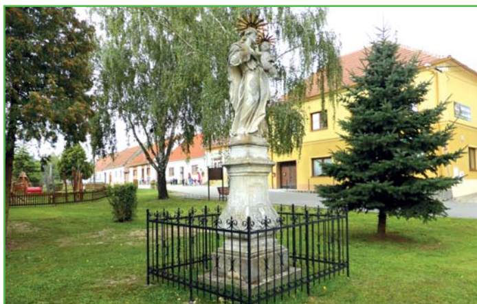
Oplocení sochy sv. Antonína na návsi