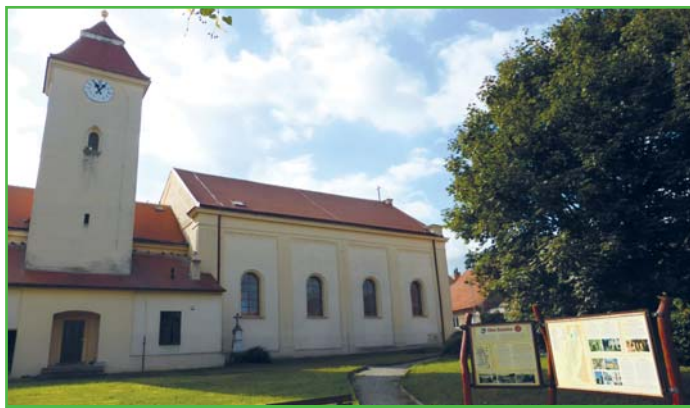
Nově nainstalovaná informační cedule u kostela