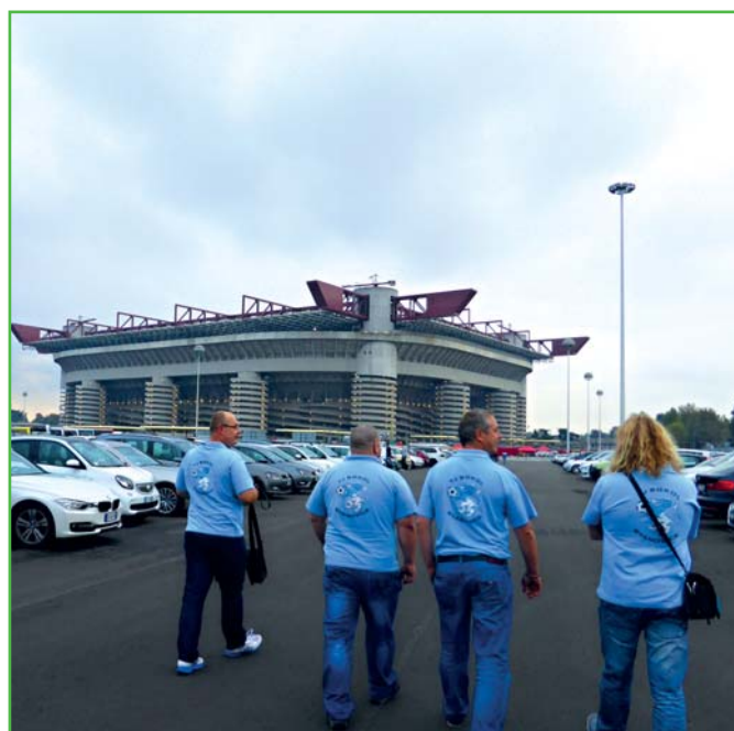
Sokoláci na San Siru