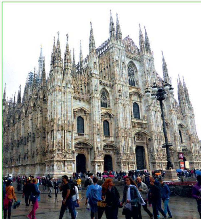
Katedrála Narození Panny Marie v Miláně je pátá největší na světě

Dvě hodiny před začátkem zápasu jsme se na stadion vydali i my. Prohlédli jsme si ještě muzeum obou klubů a pak už jsme vystoupali do 15. patra stadionu, kde jsme měli místa. Když vstoupíte do takovéto obrovské, bouřící arény, je to