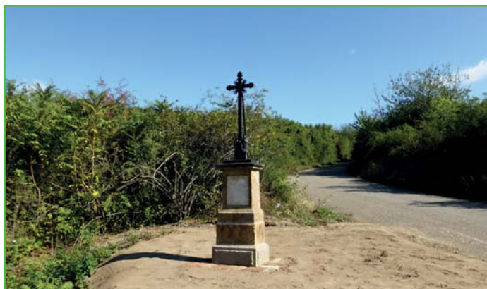
Kříž nad dálnicí po opravě