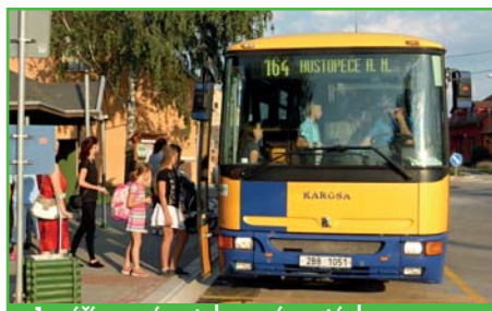
1. září - nová autobusová zastávka v provozu

a školáci i ostatní cestující tak mohli 1. září odjíždět do školy z nového nástupiště. V současné době bude ještě započata související stavba středového ostrůvku, která bude řešit parkování aut v této části obce.