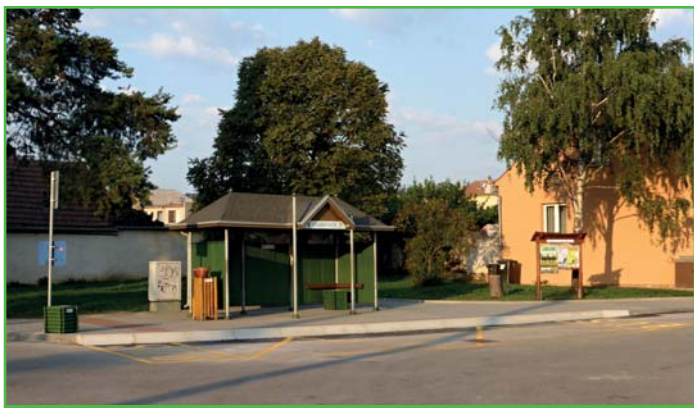
Dokončený projekt AZ s chodníkem