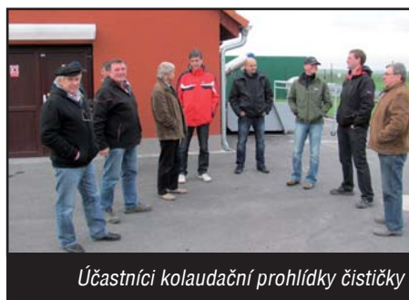
Účastníci kolaudační prohlídky čističky

Koncem října jsme mohli po ročním zkušebním provozu provést kolaudaci stavby čističky, která běží už více než rok a vyřešila problémy s odváděním odpadních vod.