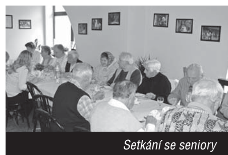
Setkání se seniory