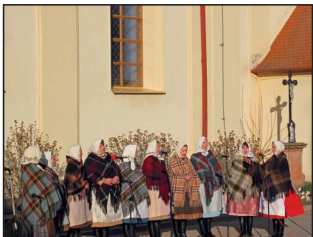
Advent na návsi