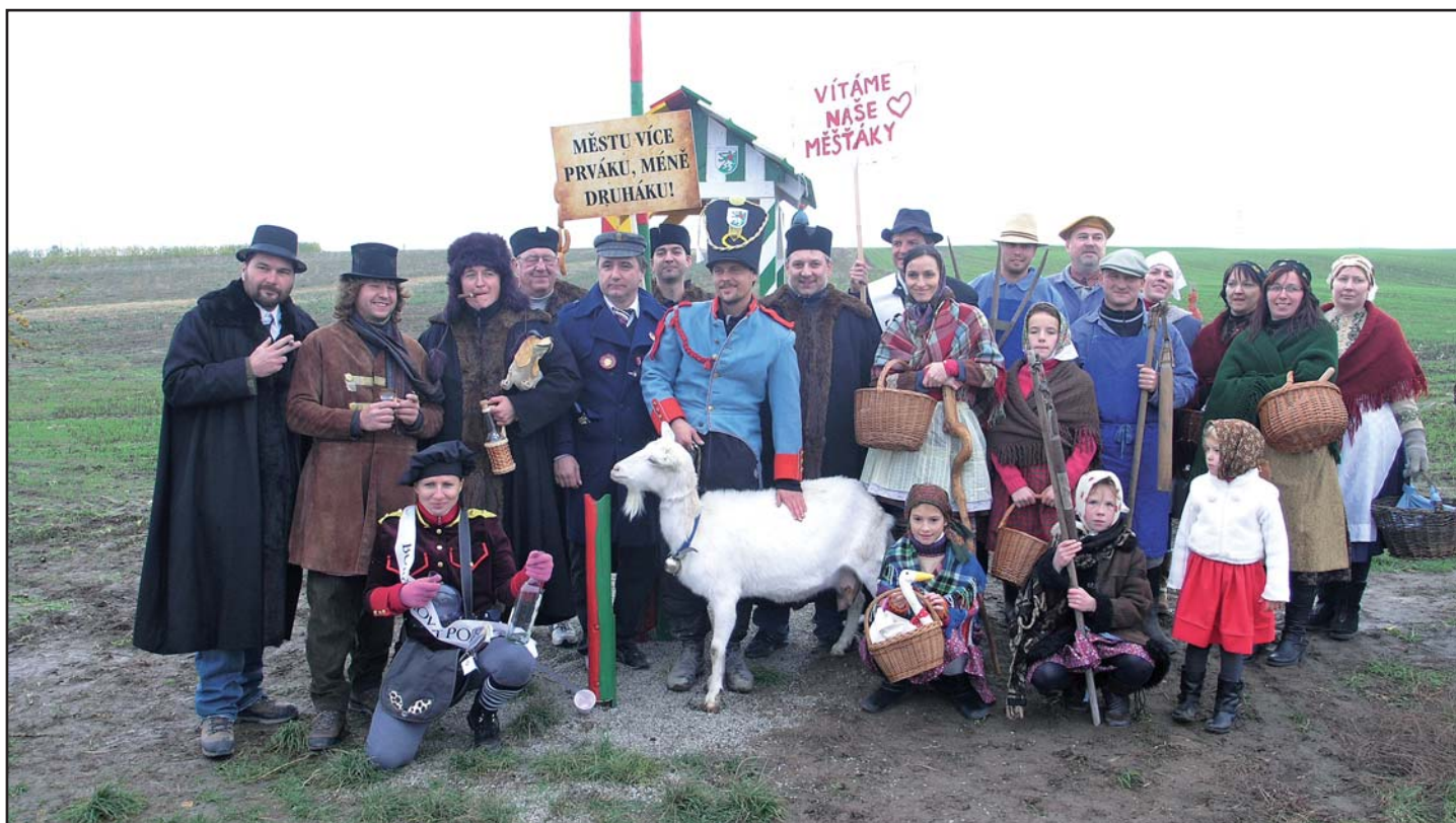
Vesnice vítá město – společné foto