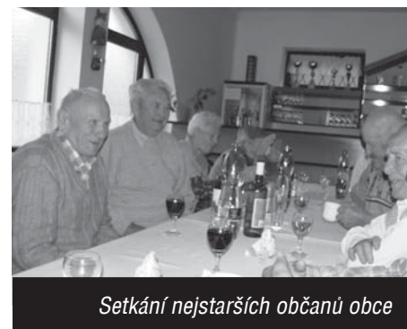
Setkání nejstarších občanů obce