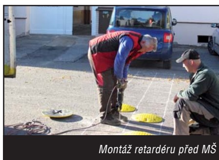
Montáž retardéru před MŠ

Mimo tyto stavby jsme se s obecními pracovníky a pracovníky veřejné služby podíleli na mnoha drobných stavbách, opravách chodníků, mostků a dvoru mateřské školy. Společně s jednotlivými stavebníky rodinných domů, se nám podařilo zprůchodnit veškeré současné chodníky v obci. K bezpečnosti chodců přispěla i montáž retardérů, kdy poslední před školkou byl nainstalován až na podzim.