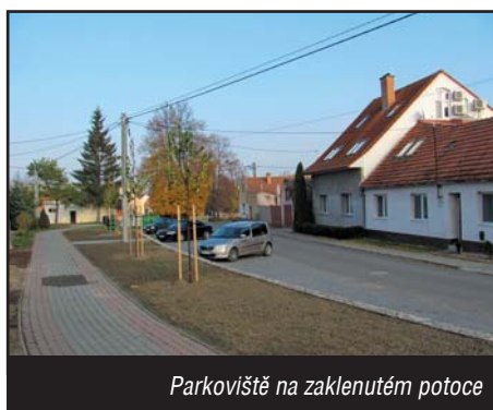
Parkoviště na zaklenuém potoce

Další stavbou, která vyrostla v letošním roce a napomohla v řešení s problémovým parkováním, a také zlepšila vzhled v této části obce, byla realizace parkoviště na zaklenuém potoce, v celkové hodnotě 280 tis. Kč.