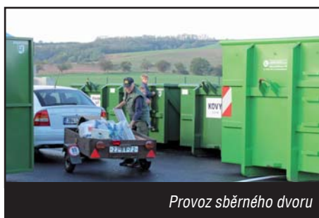
Provoz sběrného dvoru

Vážení občané, blíží se konec roku, proto si dovoluji zhodnotit letošní rok z pohledu naší obce. Navenek se zdá, že byl letošní rok oproti roku předchozímu klidnější. Je to pochopitelné, protože minulý rok probíhaly stavební práce na kanalizaci, které se přímo dotýkaly každé domácnosti. I přes to, že se mohl zdát letošní rok klidnější, byl investičně, projekčně a ostatními činnostmi opět velmi plodný. Mezi největší stavební projekty tohoto roku patřila stavba sběrného dvoru v celkové hodnotě 5,1 mil. Kč, která dnes slouží ke spokojenosti občanů.