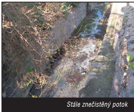
Stále znečištěný potok

Nejenom ze strany investiční, ale také z hlediska kulturního, společenského a sportovního dění udržujeme v obci aktivní život. Stačí se jenom podívat na kalendář akcí konaných v naší obci a zjistíte, že se každý měsíc u nás něco děje. Na bohatém, kulturním dění v naší obci se podílí hlavně dobře fungující zájmové organizace a spolky. Dobře pracují téměř všechny organizace, kluby, knihovna, kteří se zapojují do organizace kulturních a sportovních akcí, výstav, setkání a zapojují do činnosti i děti, kterým tak dávají dobré příklady. Na podzim jsem dával rozhovor pro Břeclavský deník, a když se mě ptali, čím se můžeme ještě ve Starovicích pochlubit, tak jsem mimo jiné uvedl: „bohatým kulturním programem a dobře fungujícími zájmovými organizacemi a spolky“. Někomu to připadá jako samozřejmost, ale fungující organizace nejsou samo sebou, je to zásluhou volnočasové práce členů jednotlivých organizací. Mimo zájmové organizace se pravidelně v zimním období scházejí ve školní jídelně senioři a v budově obecního úřadu si vybudovaly svůj „baby“ klub maminky s nejmenšími dětmi. Jsem velice rád, že si tyto, vloni zavedené činnosti, našly svoje návštěvníky, kteří se nadále pravidelně setkávají. Snažíme se v rámci našich možností vytvářet podmínky všem organizacím a občanům všech věkových kategorií. Za naši snahu jsem byl znovu oceněn Vámi občany, nominováním do soutěže