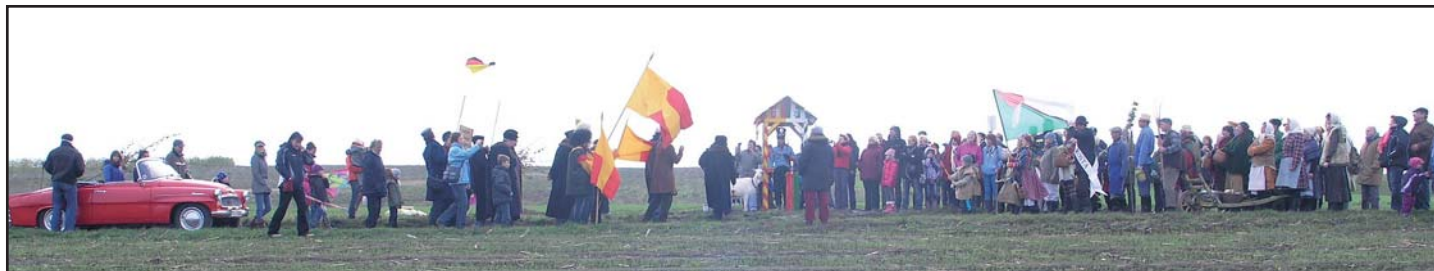
Vesnice vítá město – společné setkání na hranicích