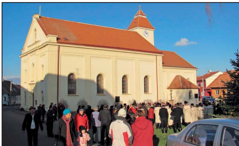
Advent na návsi