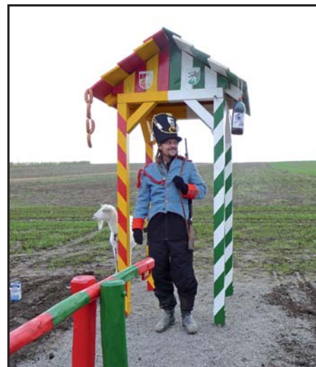
Vesnice vítá město

Více o připravovaném programu se dozvíte na www.starovice.cz