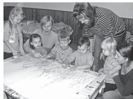
Maminky a děti z „baby klubu“ při malování kouzelného stromu