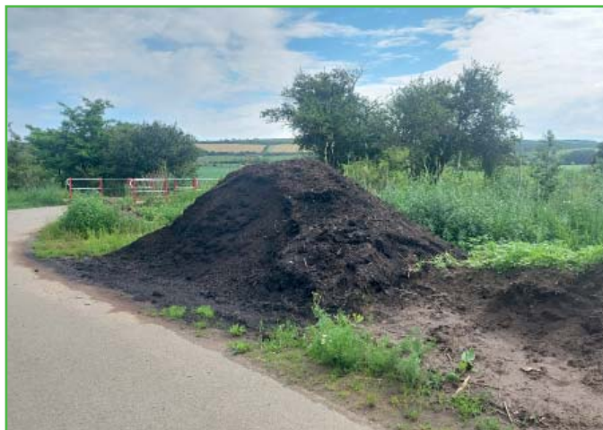
Kompost pro občany u SDO

Dále obec nabízí zdarma svým občanům kompost, který je uskladněn před sběrným dvorem. Budete-li mít zájem, informujte se na obecním úřadě.