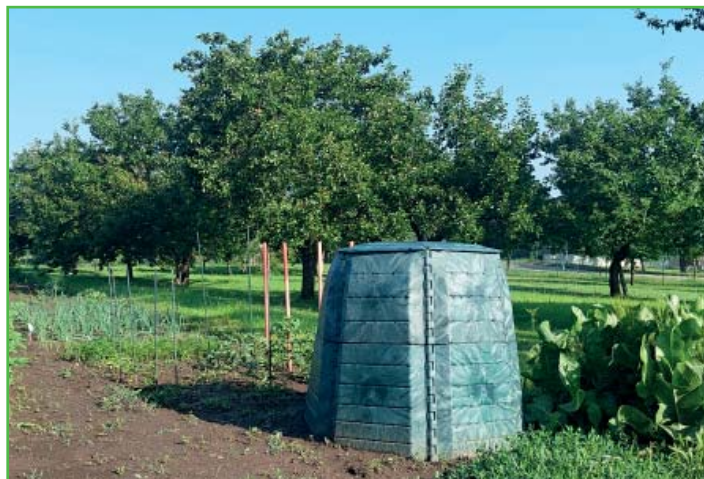
Kompostér pro občany za 400 Kč