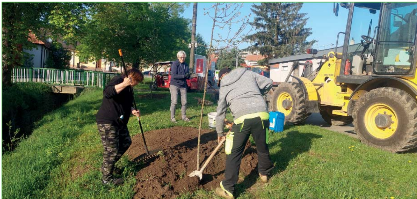
Výsadba nových stromů před obchodem COOP

Obec Starovice věnuje maximální péči zeleni na celém katastru. Údržba je v letních měsících časově náročná, přesto jde o naši prioritu. Na následujících fotkách si můžete prohlédnout část z jarních a letních údržbových prací obecních zaměstnanců.