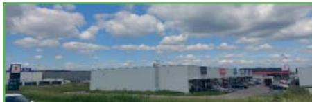
Velká průmyslová zóna nám přinese finance do rozpočtu.

rostly dvě velké průmyslové zóny (Kaufland, PPL, Plody slunce a jiné), ze kterých můžeme získat finance navíc. Zavedením koeficientu 2 pro podnikání máme propočteno, že obec získá do rozpočtu z daní z nemovitosti ze současného půl milionu další půlmilion navíc, což je pro nás všechny dobrá zpráva. Podotýkám, že domácností se tento koeficient vůbec netýká, pouze podnikatelů. Dotkne se to ovšem všech podnikatelů, i těch menších v obci, nicméně tito nemají žádné velké zastavěné plochy.