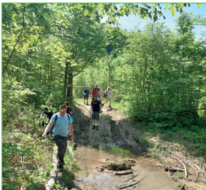
Cesta vedla krásnou přírodou.