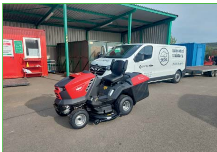
Pořízení nové sekačky na trávu.