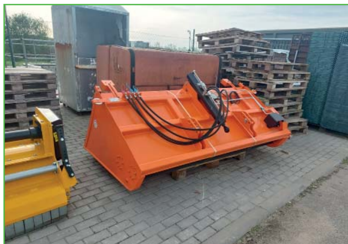
Po letošní zimě jsme přistoupili k pořízení sypače za traktor pro zimní údržbu.