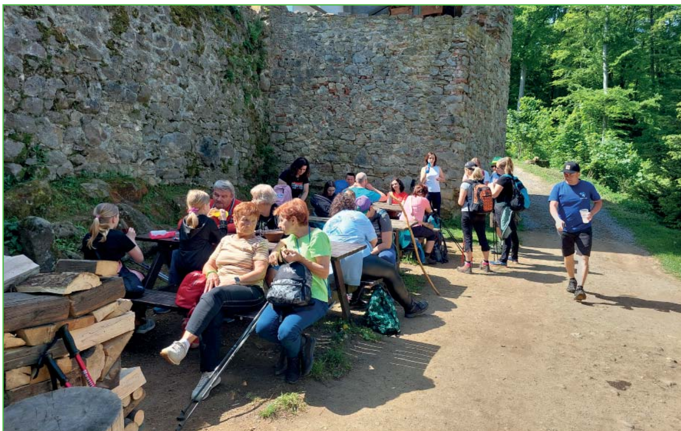
Trasou jsme navštívili zříceninu hradu Cimburk