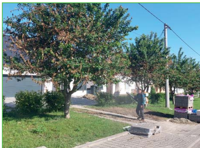
Štříkání stromů proti škůdcům