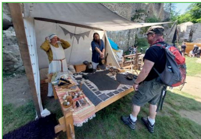
Návštěva hradu Cimburk