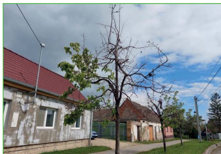
Po deseti letech jsme museli odstranit kdouloně napadené nemocí.