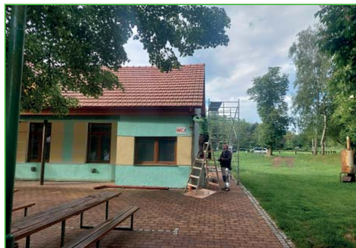
Také myslivna bude mít nový kabát.