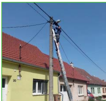
Výměna sodíkových svítidel za úsporné LED svítílny.

Co nového na obci aneb fotogalerie z posledního čtvrtletí očima obecních pracovníků