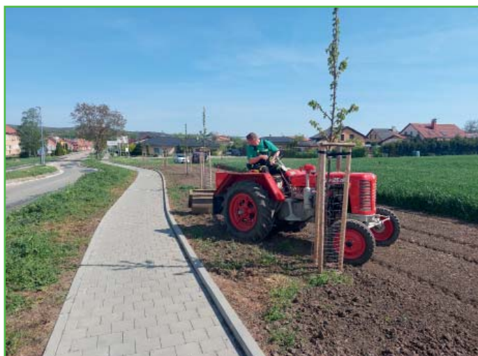
Výsadba luční louky pod nově vysázenými třešněmi