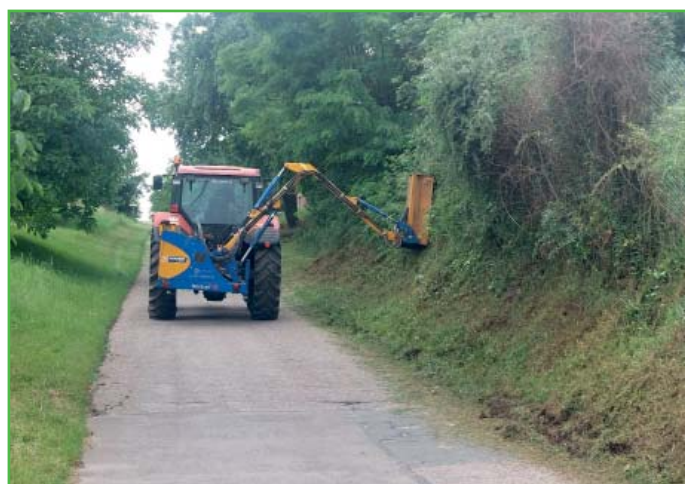
Sečení příkopovým ramenem