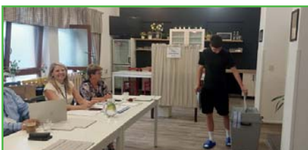
Volby do Evropského parlamentu

Vážení a milí spoluobčané, opět máme konec čtvrtletí a to je čas pro vydání dalšího čísla našeho zpravodaje. Jarní období je krásný čas, kdy příroda ozelení vše kolem nás, všechno kvete a dává nám to sílu a chuť do života. Letošní jaro bylo plné častých bouřek a spadlo i nebyvale hodně srážek, takže příroda se bujně zelenala. Nemohu zapomenout velmi významnou událost, která se odehrála v tomto období, a tou bylo mistrovství světa v hokeji konané u nás v Praze a Ostravě, kde jsme se stali po čtrnácti letech mistry světa. Vítězství v hokeji nemá jen sportovní význam, ale vítězství našich hokejistů v domácím šampionátu na čas spojilo všechny naše občany v jeden tým. Kéž by naše češství bylo tak pevné neustále, nejenom po vyhraném mistrovství světa. Následně proběhly volby do Evropského parlamentu, které zaznamenaly vysokou volební účast 35,7 %. U nás již tradičně s náskokem zvítězilo hnutí ANO před druhou koalici Spolu a nově vzniklým uskupením Motoristé. Na výsledcích voleb jde vidět roztržičnost společnosti, ale jsem optimista a zdá se mi, že se