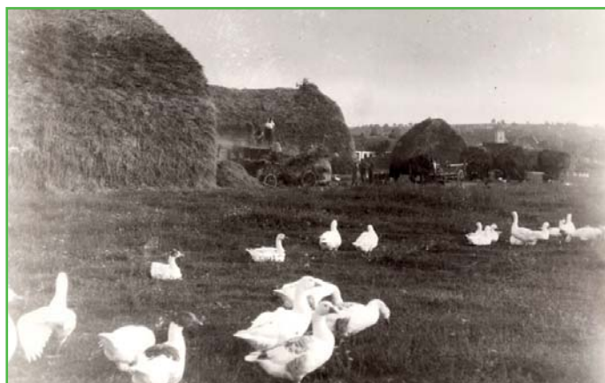
Žně na konci 60. let.