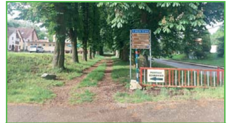
Nové místní značení

Mezi další menší stavby patří přestavba dřívější pošty na archiv obecního úřadu, renovace tanečního parketu u myslivny, vytvoření místního značení a myslivci za finanční podpory obce zahájili opravu fasády myslivny. Mezitím projektanti dokončují zadané projekty, abychom mohli realizovat další stavby (fotovoltaika, úprava prostranství nad COOP, mateřská škola, obecní úřad, spojovací silnice).