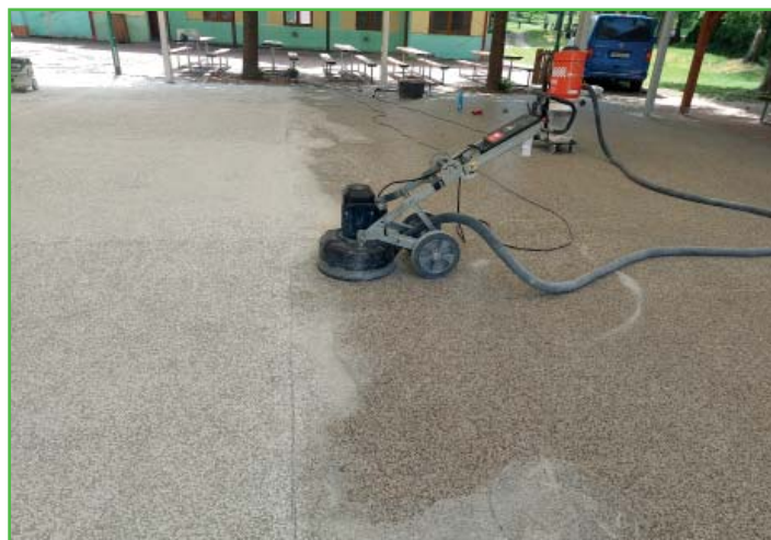
Po více jak dvaceti letech došlo k renovaci tanečního parketu.