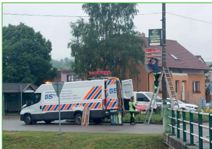
Instalace místního značení v obci.