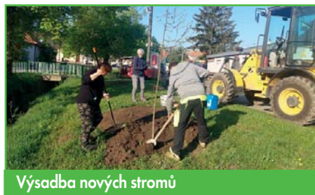
Výsadba nových stromů

Co se týká našich obecních záležitostí, v současné době máme tři stálé pracovníky a dva pracovníky na dohodu, kteří jsou plně využiti údržbou zeleně a obecního majetku. V letošním roce se snažíme věnovat zvýšenou péči zeleni, které máme mnoho a neustále nám přibývá novými výsadbami. Je vcelku jednoduché vysázet novou zeleň, ale je velmi důležité se o ni i následně starat. V současné době je to o to složitější, že s oteplováním se klimatem k nám přicházejí stále nové choroby a škůdci. Hledáme řešení, radíme se s odborníky, ale i přes to nám některé stromy odcházejí. Zeleni dáváme tolik péče, jako ještě nikdy v minulosti. Většinu úkolů jako sečení, zalévání, stříkání postřiky apod. zvládneme sami, ale na určité práce si najímáme specialisty, například na prořez vzrostlých stromů. Stromy rostou pomalu a většina občanů ani nevnímá tu postupnou změnu, ale vedeme evidenci, kdy byl každý strom vysázen, odkud dovezen a potom můžeme zhodnotit, jak se kterým dřevinám daří. Tohle je hezky viditelné až na fotografiích v porovnání v čase.