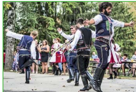
Foto z kulturní akce