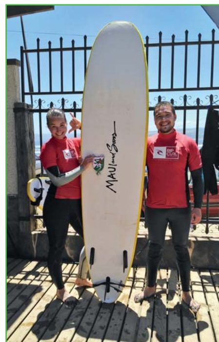
Surfování v Pichilemu

její podrobnější poznání a procestování je zapotřebí minimálně půlroční volno.