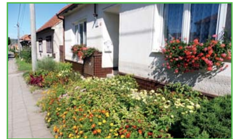
Jedna z krásných zahrádek