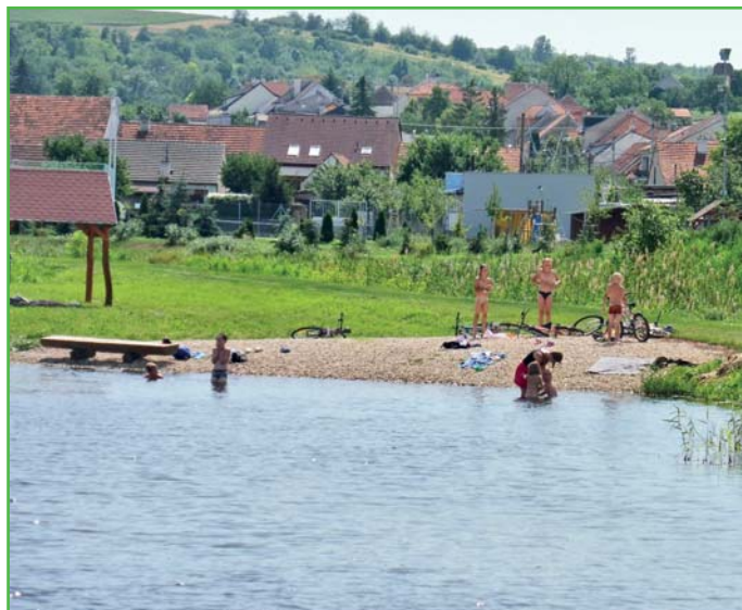
Využívání rybníka ke koupání

Dnes je rybník natolik čistý, že jde vidět i v největší hloubce u stavidla dno, tzn. průhlednost vody je více jak 2,5 m. Nechali jsme před prázdninami udělat laboratorní rozbory vody, které vyšly na výbornou. Všechny ukazatele znečištění jsou hluboce pod normami, takže koupání v našem rybníce je zcela bezzávadné.