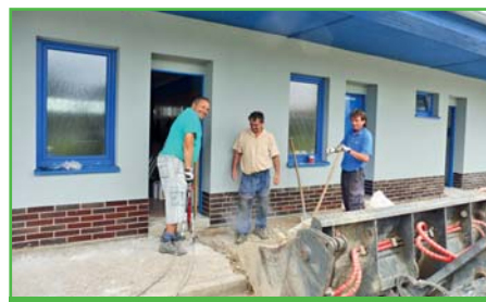
Obecní pracovníci při opravě sportovních kabin

Nyní přistoupím krátce k činnostem v obci. Pozitivním krokem v tomto období byl příjem pracovnice na úklid a údržbu zeleně. Nyní máme tedy kompletní pracovní tým, jehož práce je vidět napříč obcí a výsledkem je pěkně upravená vesnice. Zaměstnanci kromě již zmiňované údržby zeleně prováděli mnoho menších stavebních a jiných činností, které přispívají ve zvelebování obce a zkvalitňování našeho života. Bylo provedeno zateplení nádrží na čističce, které nám v zimním období způsobovaly provozní problémy. Dále byly provedeny instalace lucerniček na hřbitovní zdi, montáže nových odpadkových košů, stojanů na kola, opravy kanálů. Zaměstnanci obce se také podíleli na opravě fasády sportovních kabin a nakonec jsme se pustili ještě do výstavby parkovacích míst za školkou.