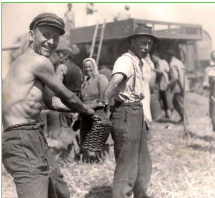
Přestávka během žňových prací (1951)