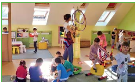
Z prvního školního dne ve školce