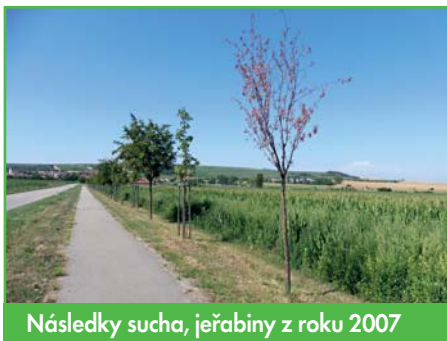
Následky sucha, jeřabiny z roku 2007

Začnu počasím. Sucho a parné počasí v letním období negativně ovlivňuje život v naší obci i celém regionu. Sucho způsobuje zemědělcům a zahrádkářům slabou úrodu a nám na obci spoustu práce navíc se zavlažováním stromů. Máme velké starosti s udržením vysázených stromů i biokoridorů, kde je vysázeno více jak 15 tisíc stromků. Jestliže chceme do budoucna mít kolem obce stromy, musíme teď pro to udělat maximum. Úbytek vláhy je natolik velký, že občas usychají i starší stromy, což je obrovská škoda. Věřme, že nám příroda pomůže a že nám alespoň v dalším období dopřeje nějaké srážky.