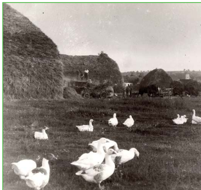
Žně v roce 1951