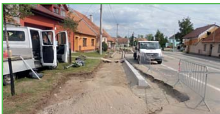
Úprava nástupiště u autobusové zastávky

na Uherčice, kterou provedla firma RUFA Velké Němčice. Stavba stála 367 tis. Kč a polovina nákladů je hrazena z dotace JMK. Úprava zastávky dnes umožňuje bezpečnější výstup z autobusu a pro zlepšení komfortu cestování dojde ještě k montáži přístřešku pro cestující. Další plánované stavby parkoviště na 0-tém řádku a chodník na 3. řádku u Vašinového budou provedeny v následujícím období. Stavbu parkoviště na 3. řádku jsme odložili z důvodu nedostatečných kapacit stavebních firem, které jsou dnes pracovně vytíženy. Se zvýšenou poptávkou po stavebních pracích firmy neúměrně navyšují ceny. Dříve jsme běžně soutěžili 70 % ceny díla oproti rozpočtu a při poslední zakázce jsme se dostali o 30 % nad rozpočtovou cenu. Z toho důvodu jsme stavbu odložili na začátek loňského roku, kdy předpokládáme, že vysoutěžíme nižší cenu.