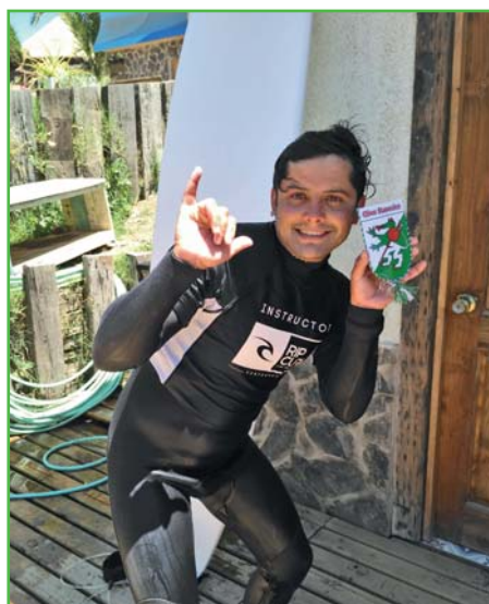
Náš nezapomenutelný instruktor