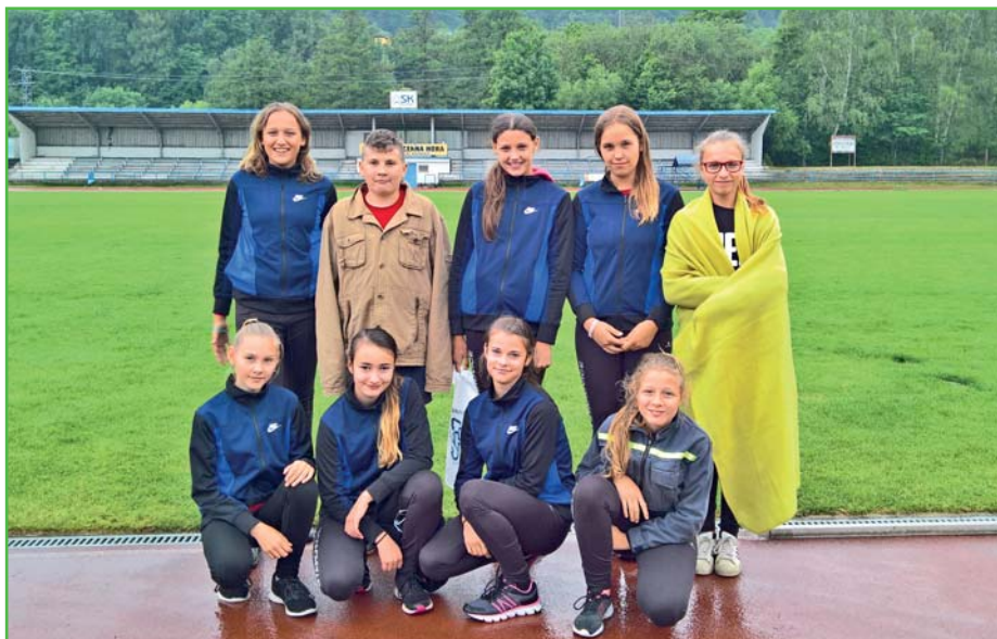
Tohle z nich zbylo po náročném dni