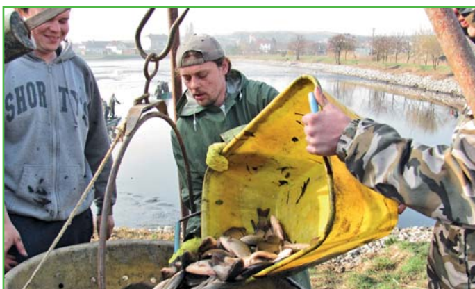
Výlov rybníka 2011 - přeživší karasi

Pokusím se vysvětlit některé otázky ke stavu a vývoji našeho rybníka. Nejprve začnu reakcí na to, jak byl rybník dříve, podle některých, „krásný“. Ano, je pravdou, že otevřená vodní plocha se spouště lidí líbila víc, ale je třeba si také říct, proč byl rybník bez vodních rostlin. Voda v rybníce byla velice znečištěná, protože téměř všechny odpadní vody z domácností tekly do rybníka. Voda měla minimální průhlednost, což znemožňovalo růst rostlin a v takové vodě se nedařilo ani živočichům. V posledních letech před revitalizací zde kromě karasů nepřežila žádná ryba. Po odbahnění rybníka a svedení odpadních vod do ČOV je dnes voda opravdu čistá a umožňuje život mnoha novým živočichům. Jen si vzpomeňte, jestli jste dříve viděli na rybníce skokany, užovky, rákosníky velké, potápky malé, slípky zelenonohé nebo početné rodiny lysek černých. Ne, žádný z těchto živočichů na rybníce před revitalizací nebyl, pouze si pamatují, že jsme každoročně v létě vytahovali uhynulé ryby.