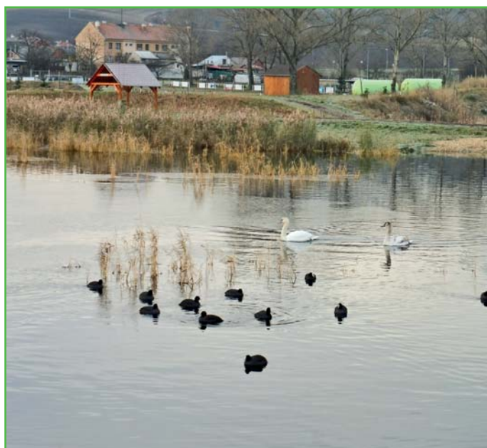
Bohatý život v rybníce

Všechno záleží na respektování se jednotlivých zájmových skupin. Na ploše revitalizace jsme nechali nainstalovat tři naučné info panely, na kterých se dočtete zajímavé informace o projektu, o fauně a flóře, která se u nás nachází. Naš rybník je ideální místo pro milovníky přírody k procházce v každém ročním období. Nenechte si tuto příležitost ujít.