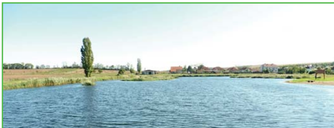
Současný pohled na rybník

Jedním z dotazů, se kterými se často setkávám, je: „Co budeme dělat s rybníkem?“ Mnoha občanům se nelíbí, že je rybník zarostlý vodními rostlinami. Je pravdou, že jsme v minulosti byli zvyklí na rybník na oko „čistý“, kde nerostl žádný rákos a byla vidět jen vodní plocha. Velká míra rákosu překvapila všechny, i nás. Po prázdninách, po dohodě s odborem životního prostředí, jsme po vyhnízdění vodních ptáků přistoupili k částečnému vysečení rákosu. Situaci průběžně řešíme s pracovníky z Agentury ochrany přírody, odborem životního prostředí a rybáři. Nemíjí tedy tak, že bychom se o rybník nezajímali, naopak, věnujeme mu velkou pozornost. Jsme stále ještě na začátku a hledáme cesty, jak rybník po revitalizaci doladit ke spokojenosti všech.