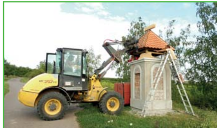
Stavba kapličky v terasách