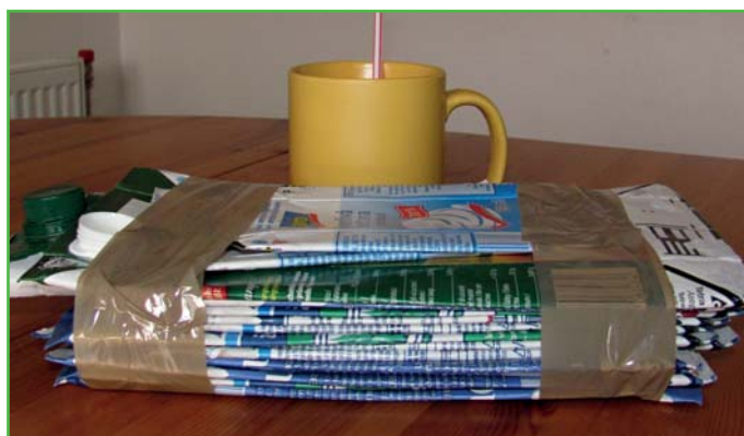
Ideální stav jak připravit kartony ke svozu

článku se chci podělit o pár postřehů, jak usnadnit práci obecním pracovníkům při zajišťování svazu. Třídíte prosím odpady správně a pečlivě je stlačujte. Velké množství domácností má připravené pytle s odpady před domy, ale špatně roztríděné nebo nedostatečně stlačené, čímž zbytečně přidávají práci svozovým pracovníkům. Další komplikaci představují zalepené pytle, které potom zaměstnanci složitě rozlepují, aby je mohli vysypat. Chápu, že to myslíte dobře, a při svozu zrovna foukal silný vítr, takže od domů, kde položili pytle volně před domy bez zavázání a zatížení, rozfoukal vítr