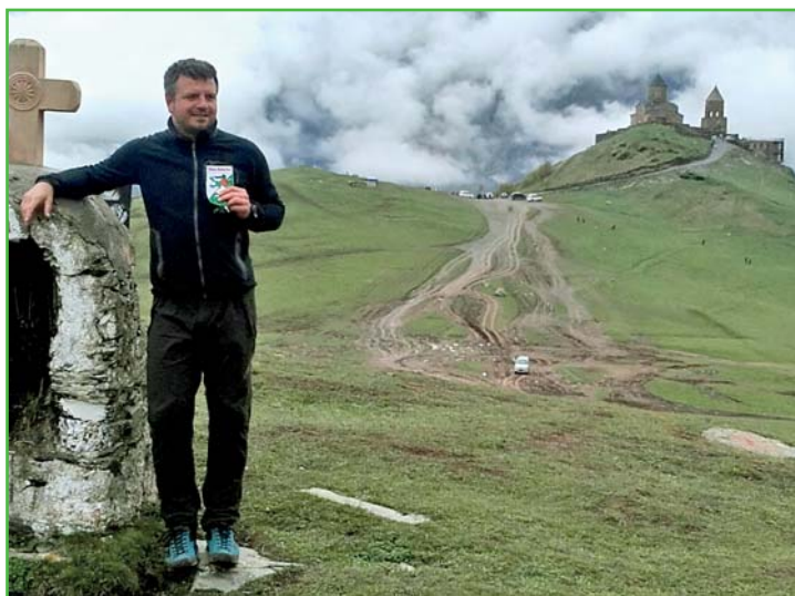
Panter na Kavkazu, v pozadí klášter St. Semeba