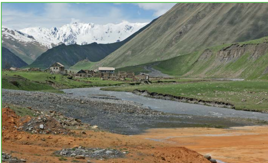
Kavkaz – Jižní Ossetie