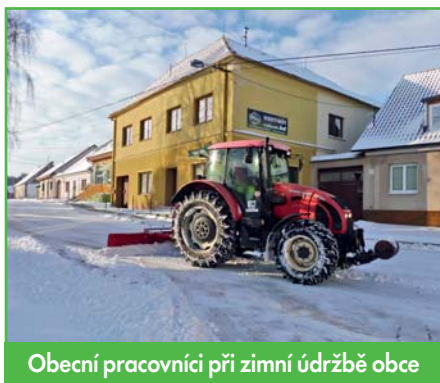
Obecní pracovníci při zimní údržbě obce

Vážené občane, po dlouhé zimě jsme konečně přivítali jaro. Letošní zima byla taková, na jakou jsme bývali v našem dětství zvyklí. Silné mrazy, dokonce napadl sníh, a tak si i děti u nás mohly užít zimních radovánek v podobě sáňkování a bruslení na rybníce. Dostatek sněhu přinesl hospodářům potřebnou vláhu na pole, mrazy zase poničily škůdce. Na druhou stranu nám dlouhá zima prodrazila topení a mrazy způsobily poruchy na vodovodu, problémy na provozu čističky a zvýšené náklady při zimní údržbě. Dovolím si pochválit naše zaměstnance, protože si se všemi problémy, které přinesla zima, dobře poradili a obec byla vždy od napadaného sněhu velmi rychle uklizena. Můžu to srovnat, protože v zimním období jsem navštívil mnoho jiných obcí a měst a málokde měli tak dobře ošetřené chodníky a silnice jako u nás.