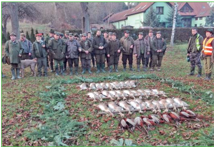
Výřad po honu v r. 2016