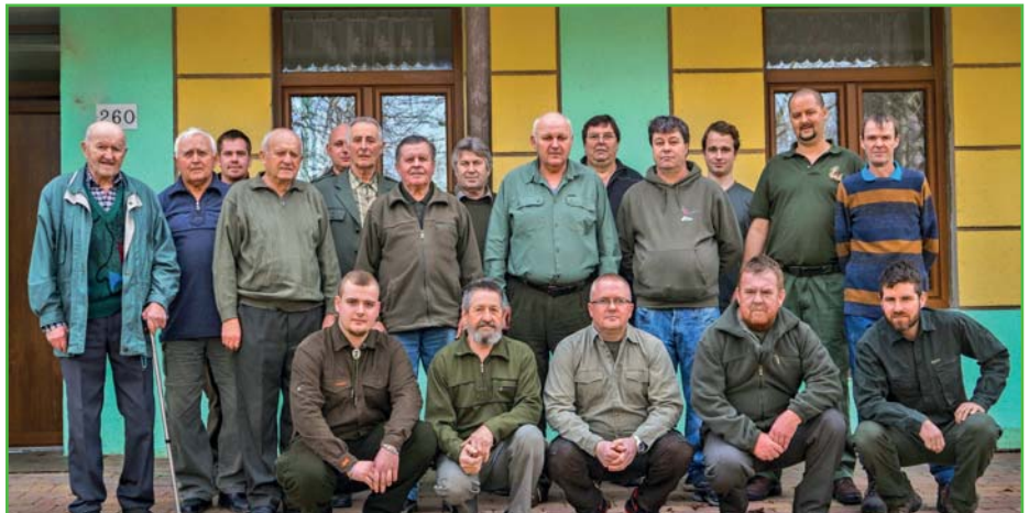
Členové Mysliveckého sdružení Starovice - únor 2017