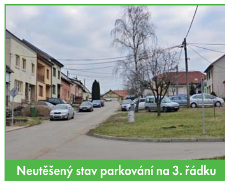
Neutěšený stav parkování na 3. řádku

Daří se nám dlouhodobě dobře hospodařit, narostly nám daňové finanční příjmy, proto si můžeme dovést každoročně investovat do obce. Pro letošní rok jsme zařadili do investičního plánu několik projektů. Po dlouhé době bychom chtěli přistoupit k budování parkovacích ploch na třetím řádku. Začneme na nejproblémovějším místě v horní části ulice, kde dnes parkuje nejvíce aut.