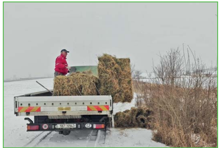
Lednové přikrmování senem