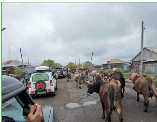
Provoz na hlavní silnici nedaleko hraničního přechodu z Gruzie do Arménie