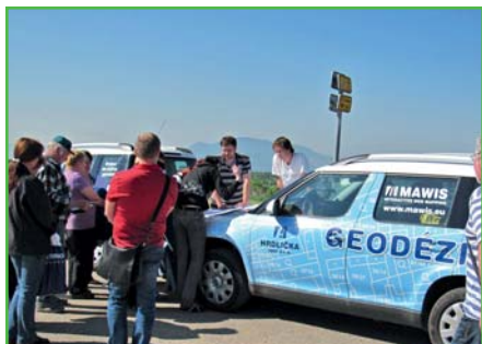
Pozemkové úpravy - foto z projednávání 2011

Důležitou informací je, že Nejvyšší správní soud zamítl žalobu na pozemkové úpravy. To znamená, že pozemkové úpravy nabydou v nejbližším období své platnosti. Poté dojde k přeparcelování pozemků