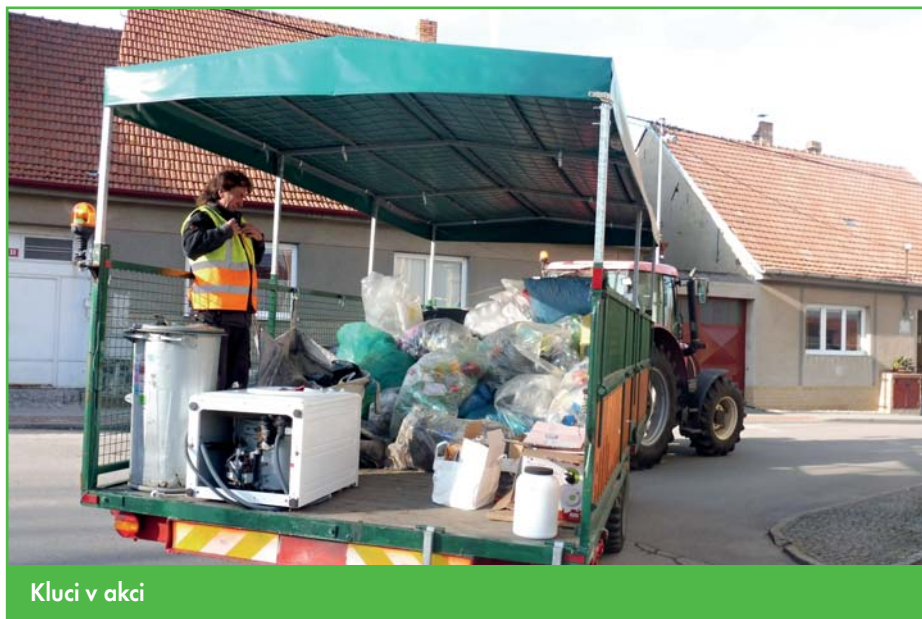
Kluci v akci