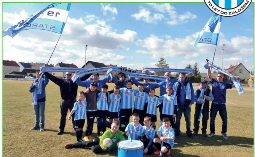
Naši žáci a za nimi fotbaloví fanoušci