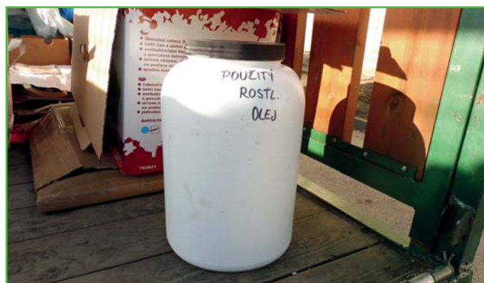
Olej připravený k likvidaci