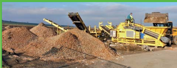
Recyklát k odebrání

Obec Starovice nabízí zdarma svým občanům stavební recyklát. Recyklát je vhodný na zpevnění cest, případně jako podkladový materiál například pod základové desky, dlažby atd. Recyklát je k dispozici na pozemku před sběrným dvorem. Po dohodě jsme schopni materiál za úplatu dovézt obecním traktorem.