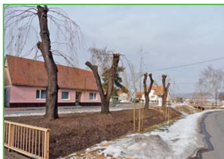
Odborné prořezy vrb

V zimním období naši zaměstnanci mimo údržbu obce prováděli prořez dřevin. Prořez provádíme v zimě pravidelně a přistupujeme k němu po důkladném zvážení a doporučení většinou odborníků - krajinářů, přesto se kácení většinou setkává s nelibostí některých občanů. Je nutné si uvědomit, že i zeleň a stromy potřebují svoji údržbu formou prořezání a některé nevhodné, staré a nebezpečné stromy je nezbytné odstranit úplně. V zimním období většinou odstraňujeme nevhodné dřeviny, které hned v průběhu roku nahrazujeme novými na základě zpracovaných projektů. V letošním roce budeme upravovat zeleň ve spodní části obce, kolem potoka. Při této příležitosti bych vás rád požádal, abyste nevysazovali na obecních pozemcích žádné dřeviny bez předchozího projednání s obcí. Předejdete tak zbytečným následným problémům s nekoncepční a nevhodnou výsadbou.