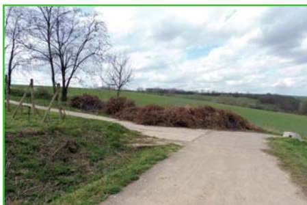
Skládka růží v vinohradů