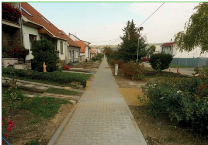
Chodník po rekonstrukci