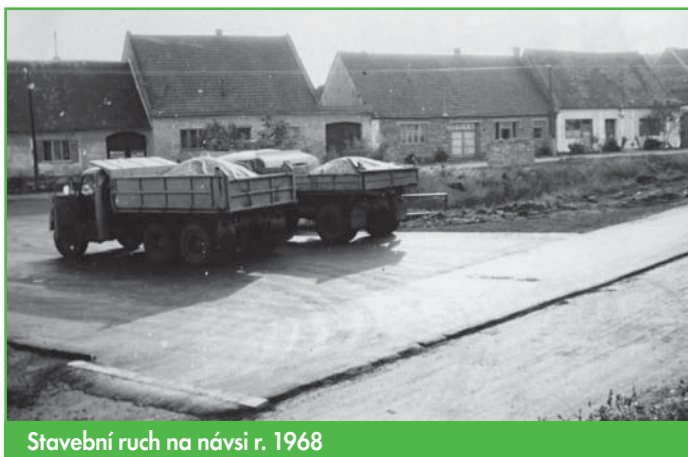
Stavební ruch na návsi r. 1968

Křesťanská folková kapela SRDCE ze Šakvic vás zve na svůj tradiční vánoční koncert