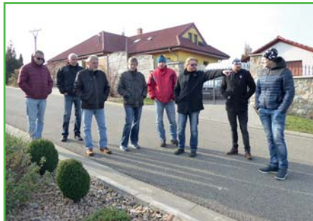
Zastupitelé při obchůzce obce

zahájilo svoji činnost pracovní poradou a následně pracovní obchůzkou obce, kde se v terénu řešily probíhající stavby a připravované projekty. Je po volbách, máme spoustu plánů, ale také bychom chtěli řešit méně populární věci, jako je parkování vozidel, zábory za domy nebo nakládání s odpady. O připravovaných projektech a činnostech vás budeme průběžně informovat v dalších zpravodajích.