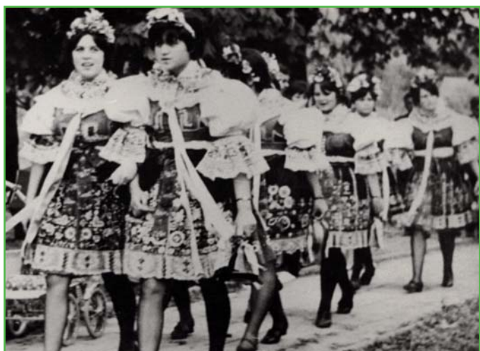
Stárky roku 1968