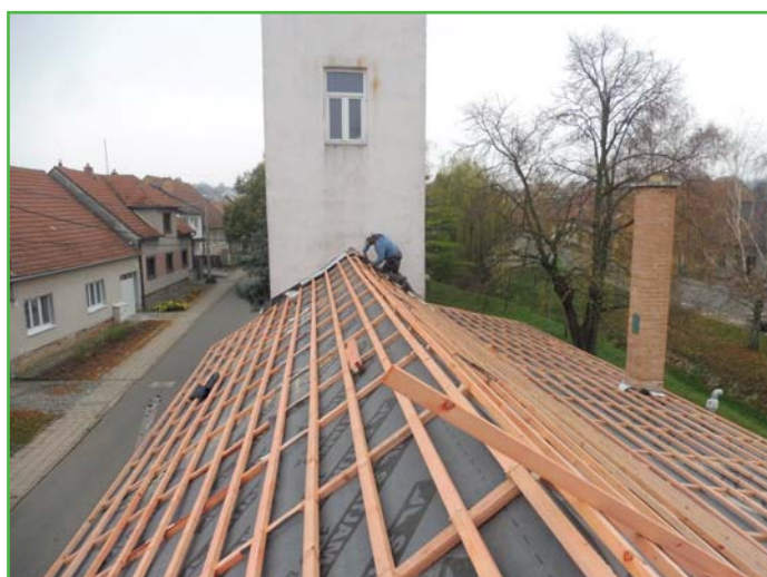
Rekonstrukce střechy garáže hasičky