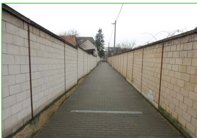
Ulička po rekonstrukci