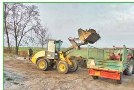
Úklid po vinařích na náklady obce