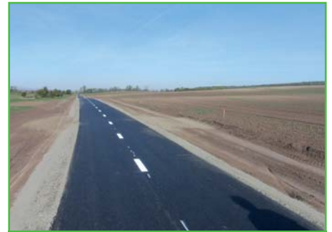
Dokončená stavba cyklostezky

staveb na 3. řádku jsme zdárně zrealizovali nejdražší stavbu letošního roku Cyklostezku ze Starovic do Hustopečí, kdy stavba skončila řádně v termínu a bez jakýchkoliv více prací, což se ne vždy podaří. Také byla provedena stavba parkoviště na 2. řádku, parkovového hřiště ve sportovním areálu, dokončena stavba kapličky a nakonec jsme provedli výměnu střechy hasičky, do které nám zatékalo. Také jsme na sklonku roku zakoupili cisternu za