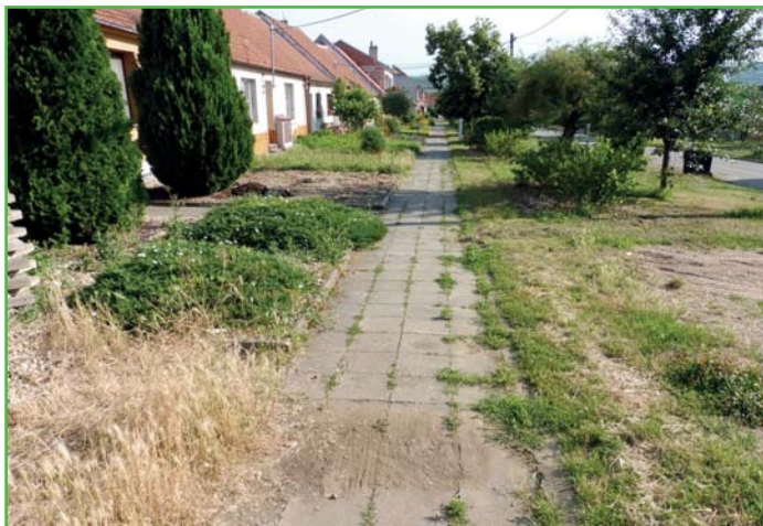
Chodník na 3. řádku před rekonstrukcí