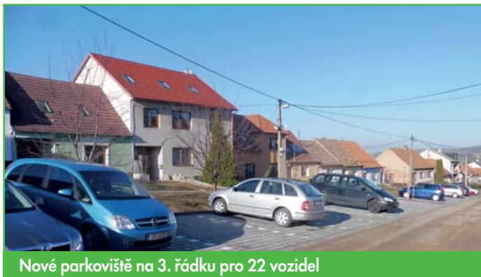
Nové parkoviště na 3. řádku pro 22 vozidel