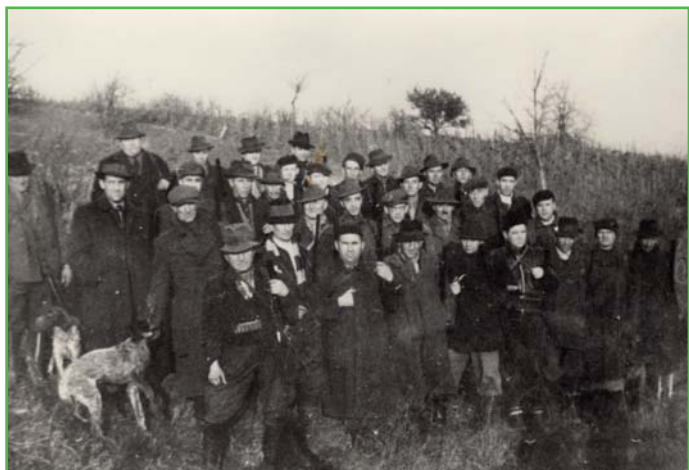
V roce 1948 bylo založeno myslivecké sdružení