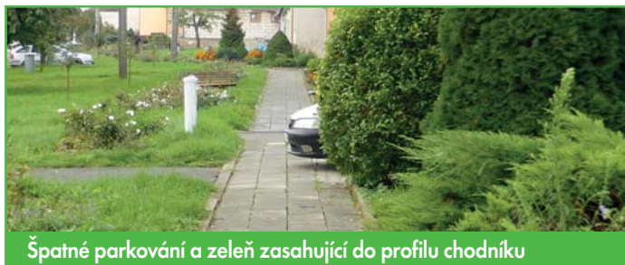
Špatné parkování a zeď zasahující do profilu chodníku