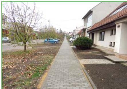
Dokončená stavba chodníku na 3. řádku

Jelikož je konec roku, dovoluji si krátce zhodnotit letošní rok z pohledu investičních akcí v obci. Největší stavební ruch probíhal letos na 3. řádku, kde návaznost jednotlivých prací byla ukázková. Začali jsme výměnou části dešťové kanalizace, aby poté mohla společnost VAK Břeclav provést výměnu vodovodního řádu. Hned za pokládkou vodovodu jsme začali rozebírat starý chodník, do kterého byly usazeny chráničky na optická vlákna a následně pokládán nový chodník, který byl dokončen 31. 10. 2018.