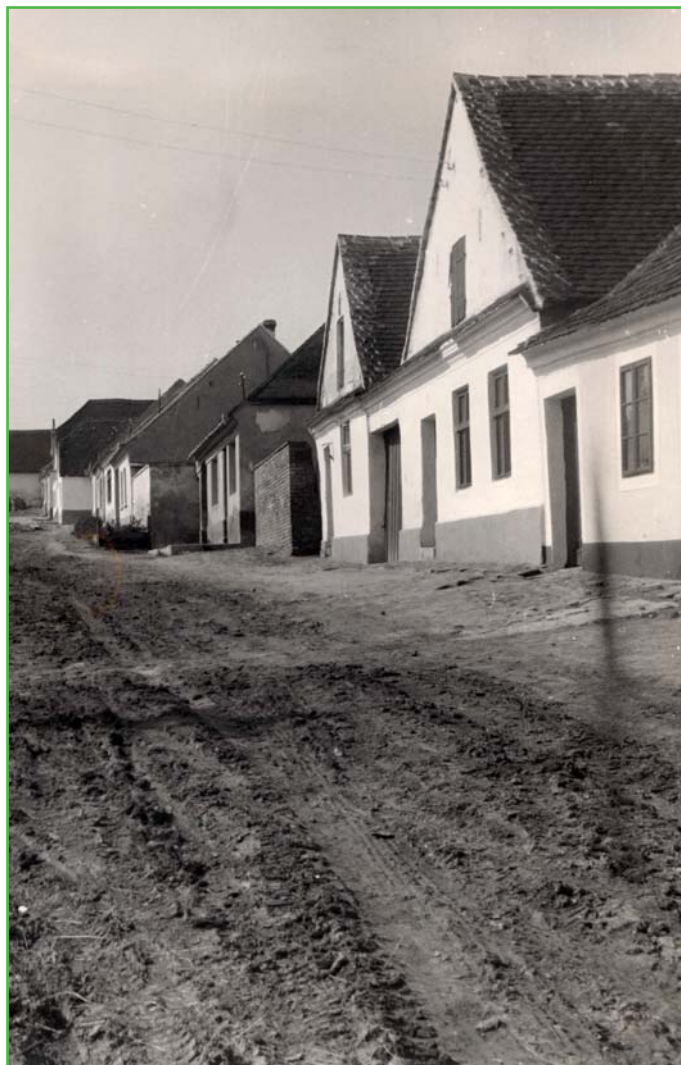
Třetí řádek v roce 1958