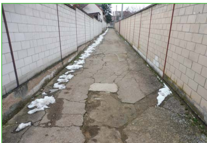
Ulička před rekonstrukcí