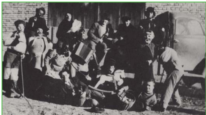
Ostatky roku 1948 - maškary