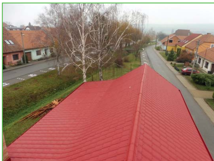
Hasička po rekonstrukci