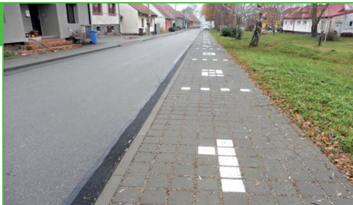
Nové parkoviště na 2. řádku pro 20 vozidel