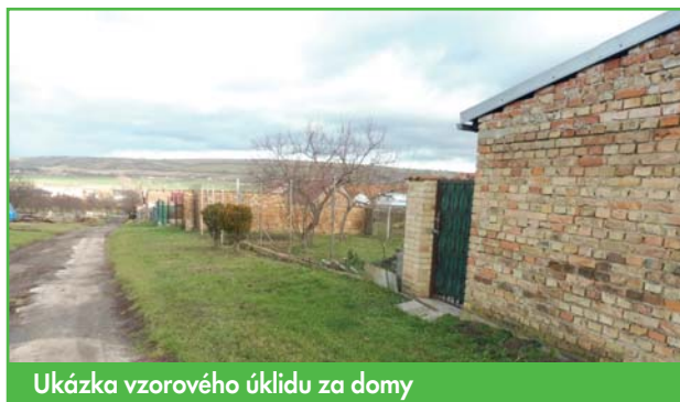
Ukáзка vzorového úklidu za domy

Vinaři si tedy obdělávají svůj vinohrad, prodají hrozny nebo víno a obec po nich uklidí... Do budoucna chceme takovýmto situacím zamezit, a proto vydáváme přísný zákaz ukládání ja-