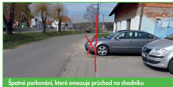
Špatné parkování, které omezuje průchod na chodníku