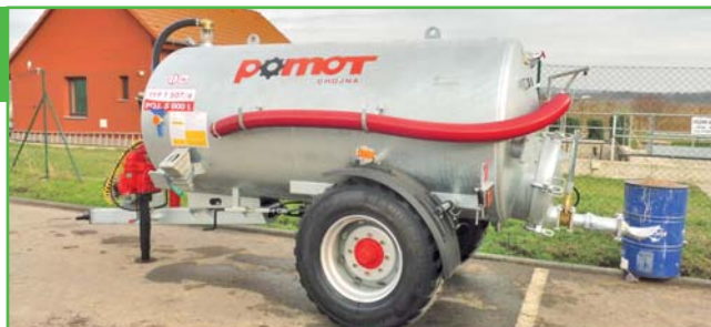
Nově pořízená cisterna

Za poslední roky se nám nebyvale daří a podařilo se nám pořídit mnoho techniky, kterou využíváme k denním úkolům a údržbě. Obec má dnes výkonný nakladač NEW Holand, dva traktory, vlek, štěpkovač, příkopové rameno a mnoho menších strojů. Koncem letošního roku jsme pořídili pětikubíkovou cisternu na zavlažování stromků, ale zároveň ji chceme poskytnout i občanům, kteří nejsou napojeni na kanalizaci, na vývozy jímk. Pokud bude technika volná, nabízíme vám ji za úplaty k využití. Ceny jsou uvedeny níže.